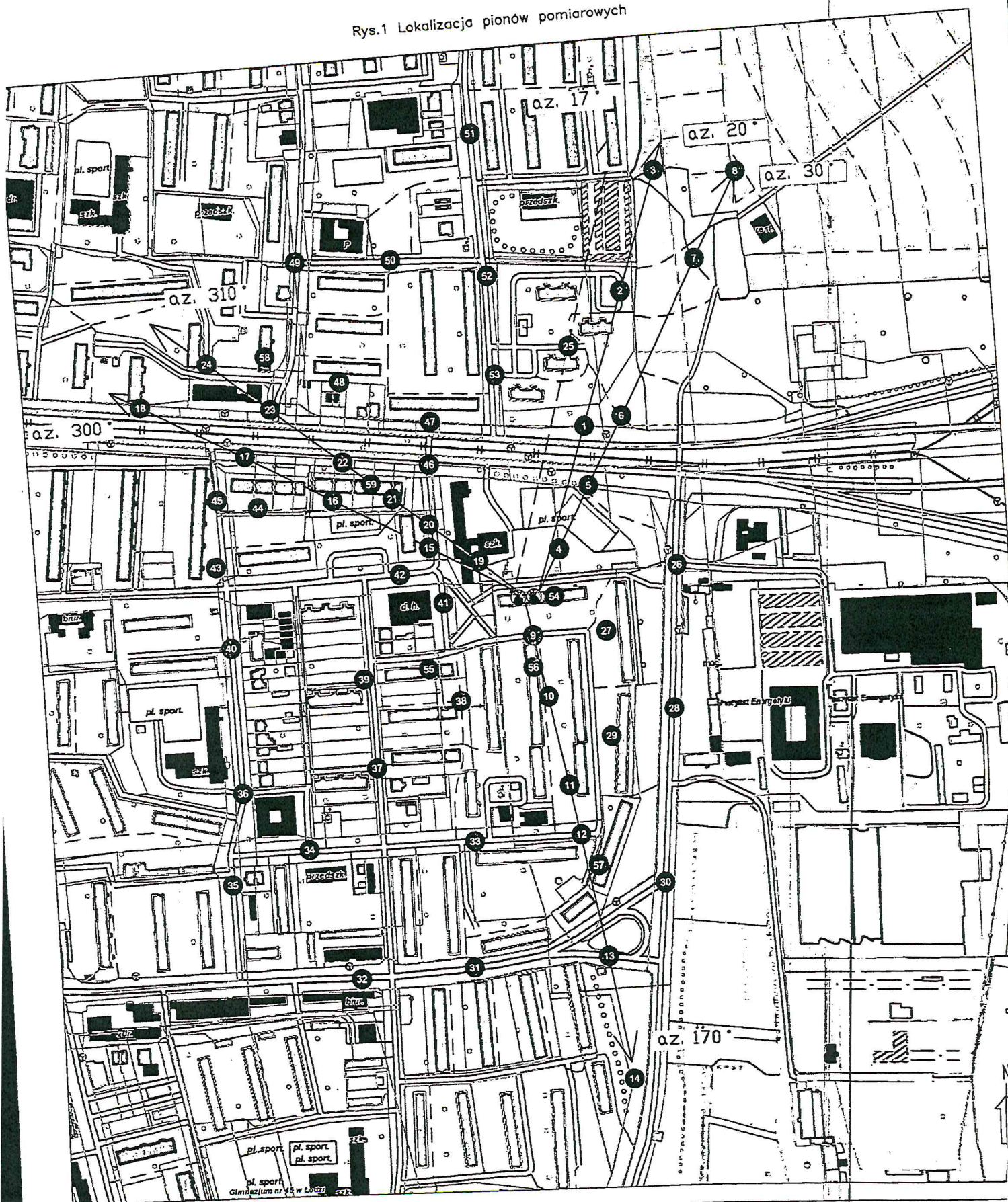
Rys.1 Lokalizacja pionów pomiarowych