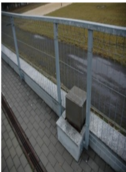
Fundamenty pod słupy oświetleniowe