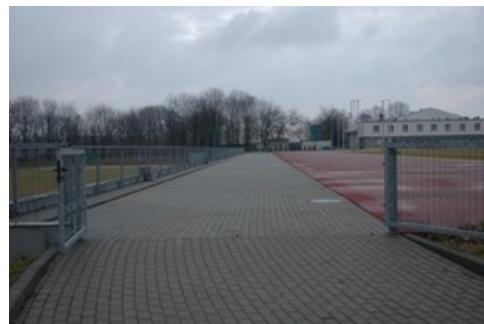
Widok wejścia na trybuny od strony ulicy Tamka – widok miejsca usytuowania trybun