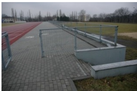
Widok wejścia na trybuny od strony budynku administracyjnego