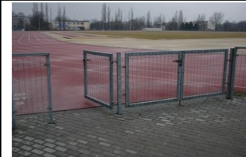
Przykładowe furtki, które można będzie wykonać w planowanym ogrodzeniu pomiędzy planowaną trybuną a bieżnią