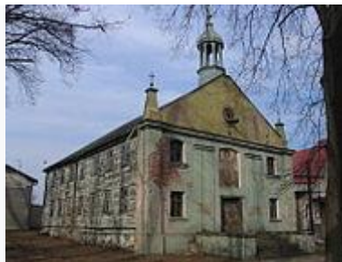
Kościół ewangelicki z 1838 r. znajdujący się dawniej na rynku w Nowosolnej; dziś w skansenie łódzkiego budownictwa drewnianego przy Muzeum Włókiennictwa w Łodzi

W 1823 r. Nowosolna liczyła 1059 mieszkańców zamieszkałych w 86 domach, przewyższając w tym czasie liczbę mieszkańców pobliskiej Łodzi – chociaż już niedługo, ponieważ w wyniku decyzji władz administracyjnych Królestwa Polskiego przeznaczającego to miasto na osadę fabryczną, w 1830 r. liczba jego mieszkańców wzrosła gwałtownie do 4 tysięcy.