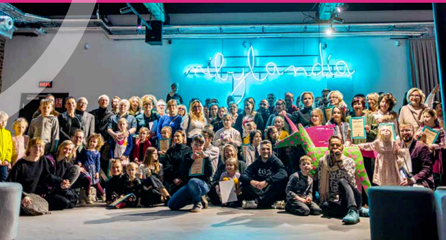
TEATR PINOKIO, WIGENCJA

Wartości i zasady określone w PRK 2030+ będą realizowane poprzez programy i działania miejskich instytucji kultury oraz inne, wymienione wyżej podmioty i osoby.