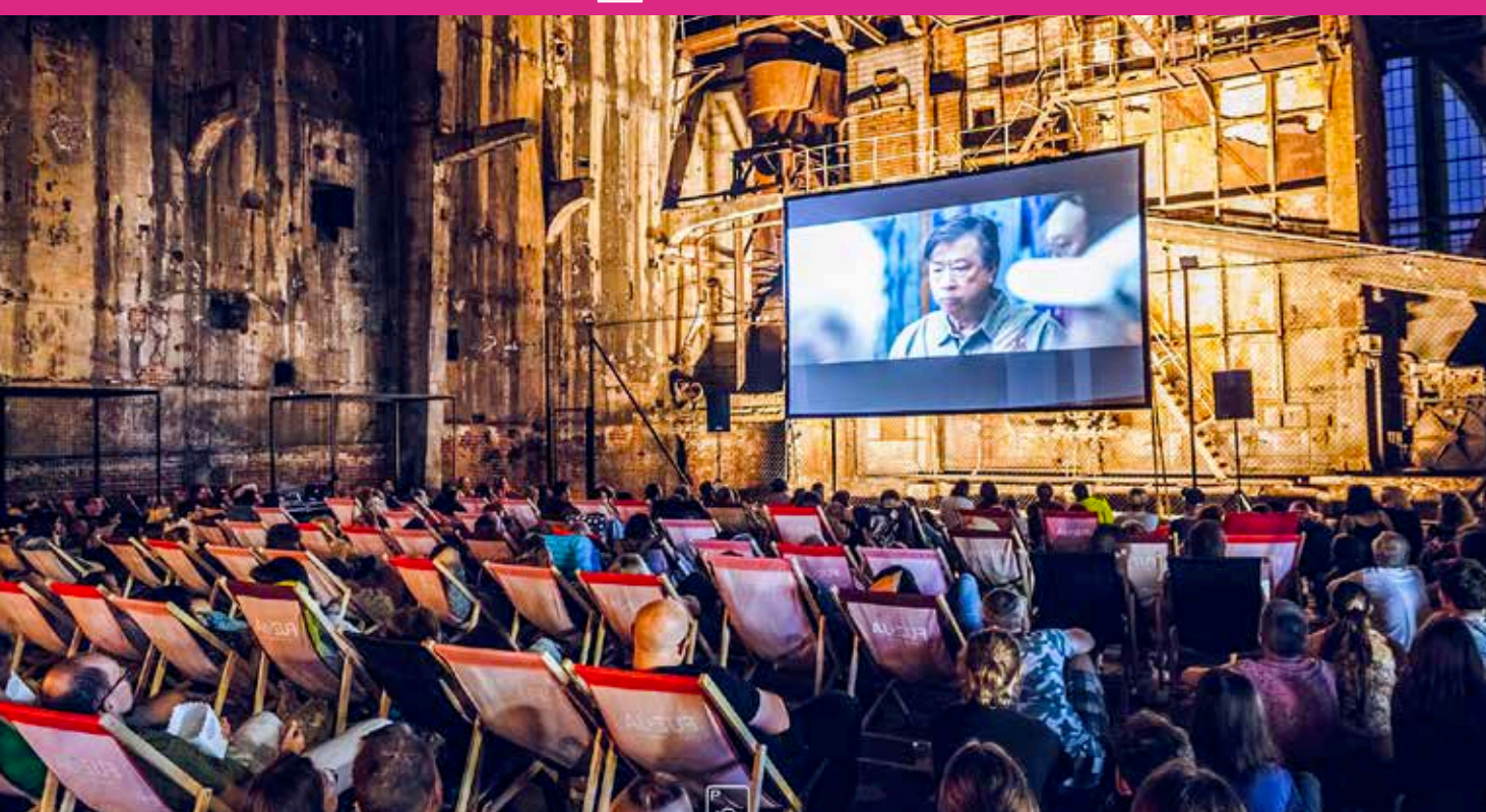
LETNI FESTIWAL FILMOWY TME POLÓWKA. FUNDACJA INICJATYW KULTURALNYCH PLASTER.