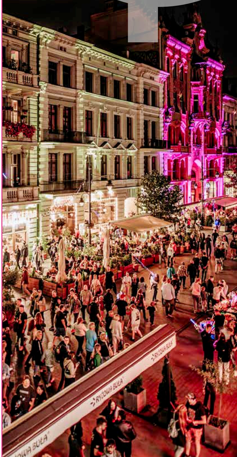
LIGHT . MOVE . FESTIVAL

Cele strategiczne Polityki rozwoju kultury dla miasta Łodzi 2030+ wpisują się bezpośrednio w trzy obszary tematyczne wyodrębnione dla Celu strategicznego III: Łódź odpowiadająca na oczekiwania interesariuszy, tj. Miasto twórcze, Miasto wartościowego wypoczynku oraz Łódź liderem sektora audiowizualnego, Celu strategicznego I: Łódź silna i odporna – obszar tematyczny Miasto jakościowej edukacji.