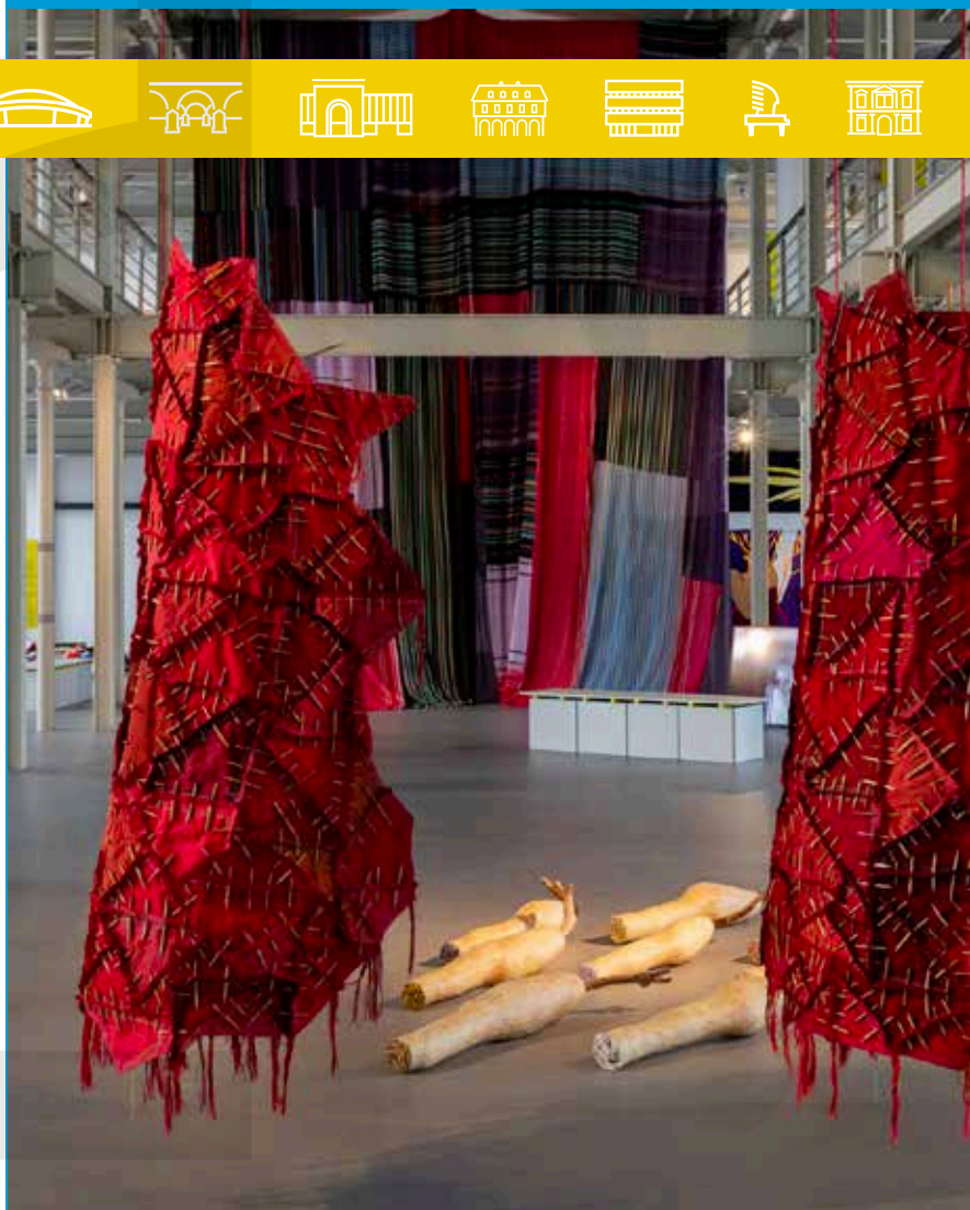
CENTRALNE MUZEUM WŁÓKIENICTWA

Miasto prowadzi efektywną współpracę z organizacjami pozarządowymi dotyczącą realizacji zadań z zakresu kultury, sztuki, ochrony dóbr kultury i dziedzictwa narodowego. W ramach otwartego konkursu ofert realizowane są m.in. wydarzenia znane już w skali kraju, takie jak Letnia Akademia Jazzu, Wielka Gala Jazzowa „Grand Prix Jazz Melomani”, Festiwal Kamera Akcja, Międzynarodowy Festiwal Teatralny „Retroperspektywy”, Międzynarodowy Festiwal