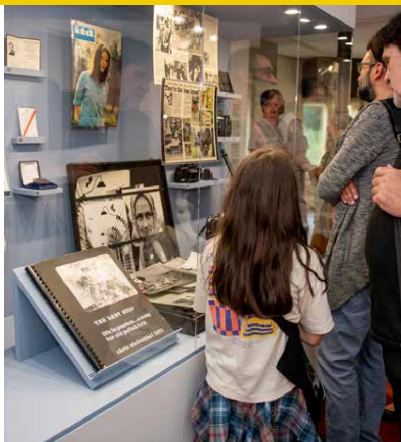
WYSTAWA W MUZEUM MIASTA ŁODZI

W przyjętej Strategii Rozwoju Miasta Łodzi 2030+ określono także kierunki prowadzenia rozwoju miasta, odzwierciedleniem przyjętych w strategii celów jest lista strategicznych przedsięwzięć. Zadania związane z Polityką Rozwoju Kultury