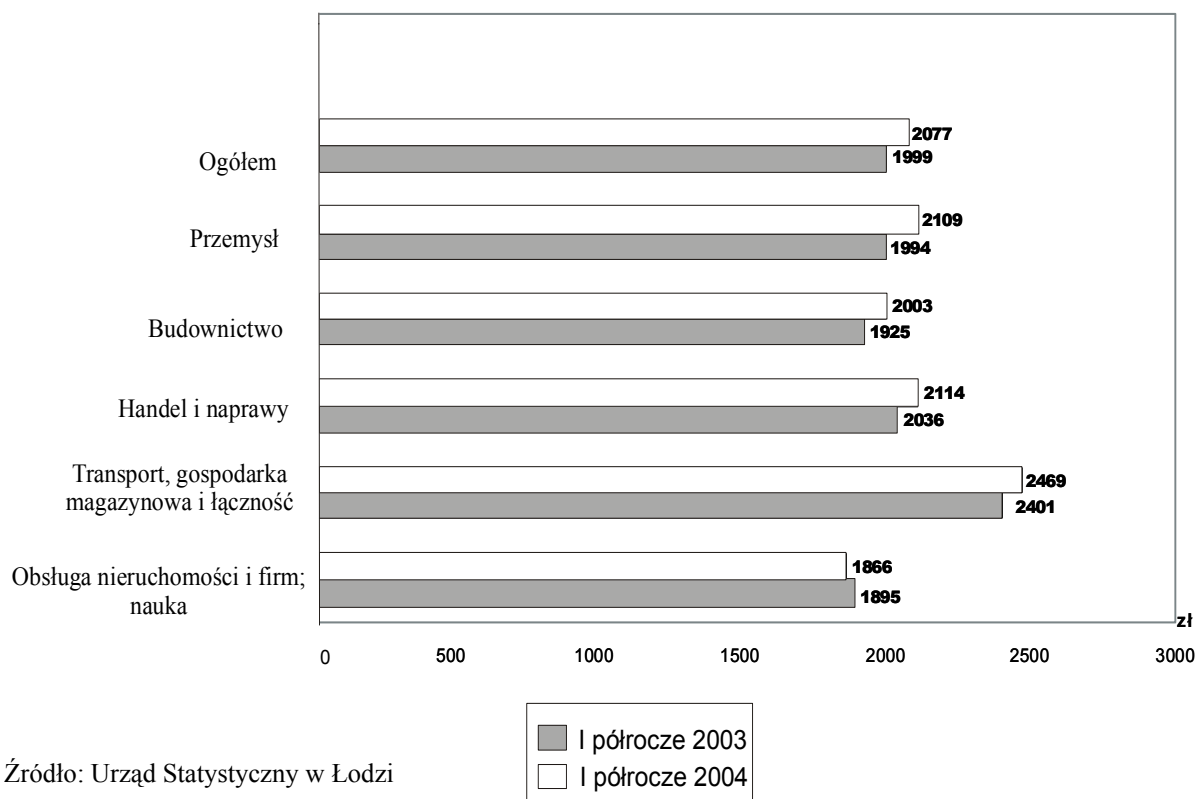
Wykres 2. Przeciętne miesięczne wynagrodzenie brutto w sektorze przedsiębiorstw łódzkich w I półroczu 2003 r./ 2004 r.

Nadal wyższe zarobki otrzymywali pracownicy zatrudnieni w sektorze publicznym. Przeciętna płaca brutto w czerwcu 2004 r. wyniosła tam 2483 zł i była wyższa aż o 10,8% niż przed rokiem, w sektorze prywatnym natomiast – 1978 zł i wzrosła o 3,0%. Wysokie koszty zatrudnienia ponoszone przez pracodawców, szczególnie odczuwalne przez właścicieli prywatnych firm i duża podaż siły roboczej na rynku pracy skutecznie hamują wzrost wynagrodzeń w Łodzi.