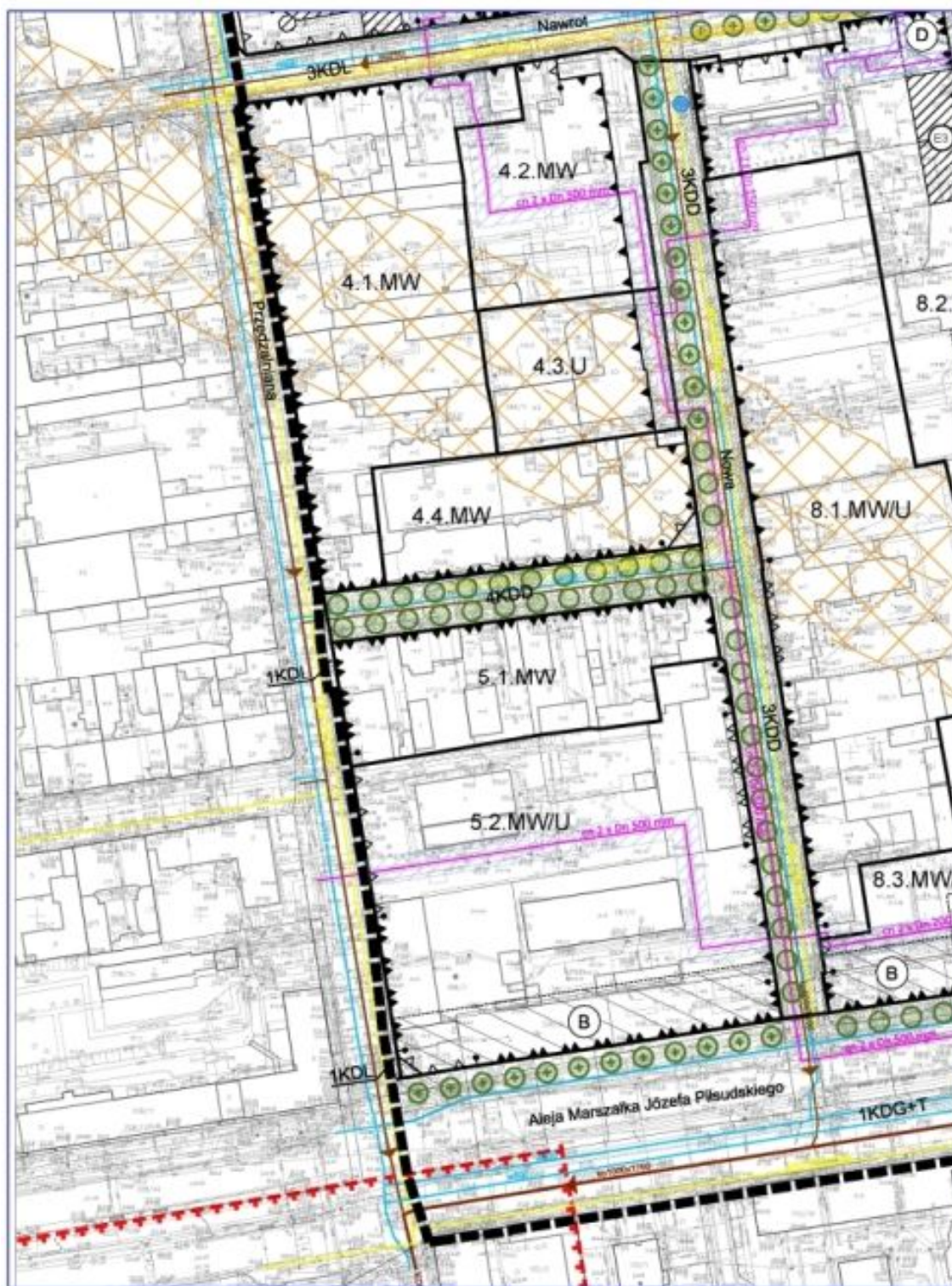
ARKUSZ NR 3