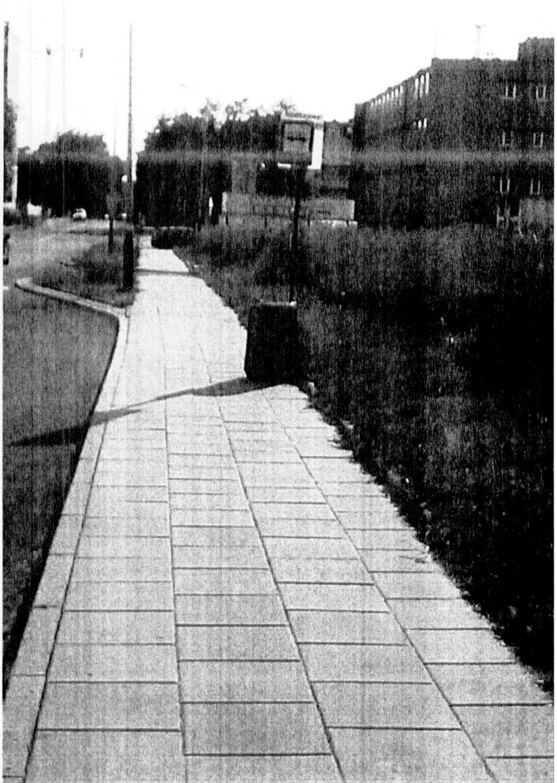
Przystanek nr 2185