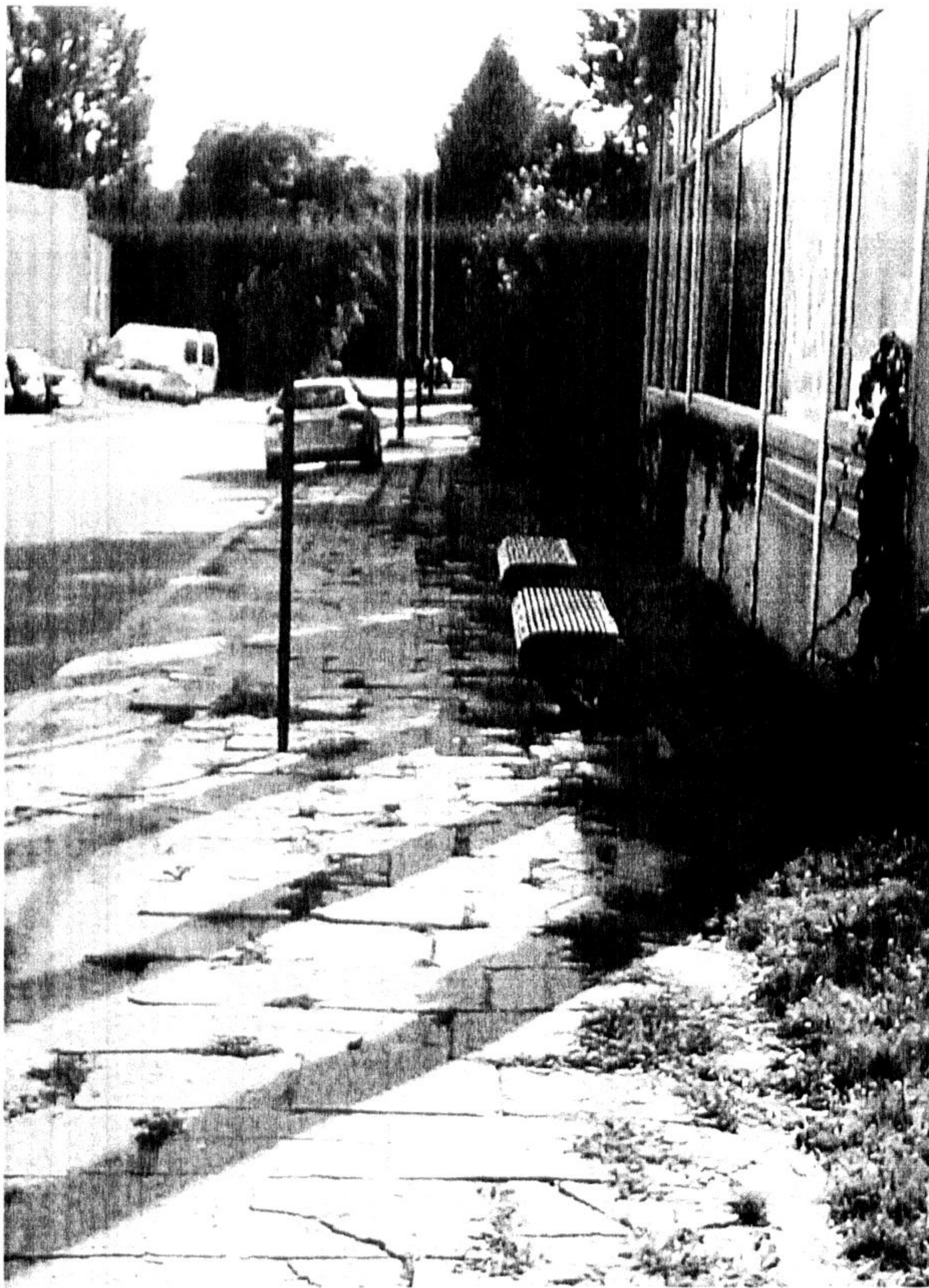
Przystanek nr. 2263