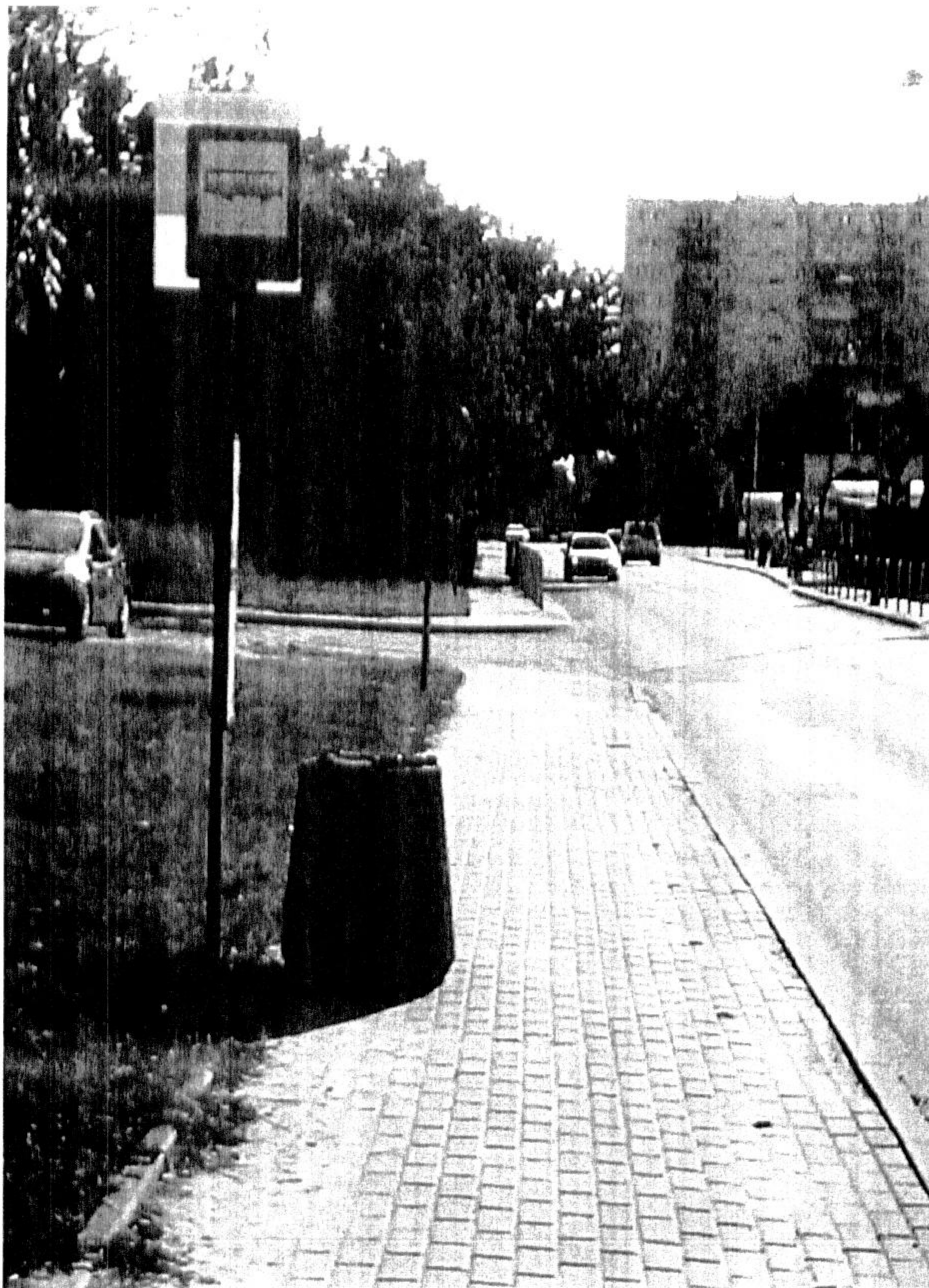
Przystanek nr 2192