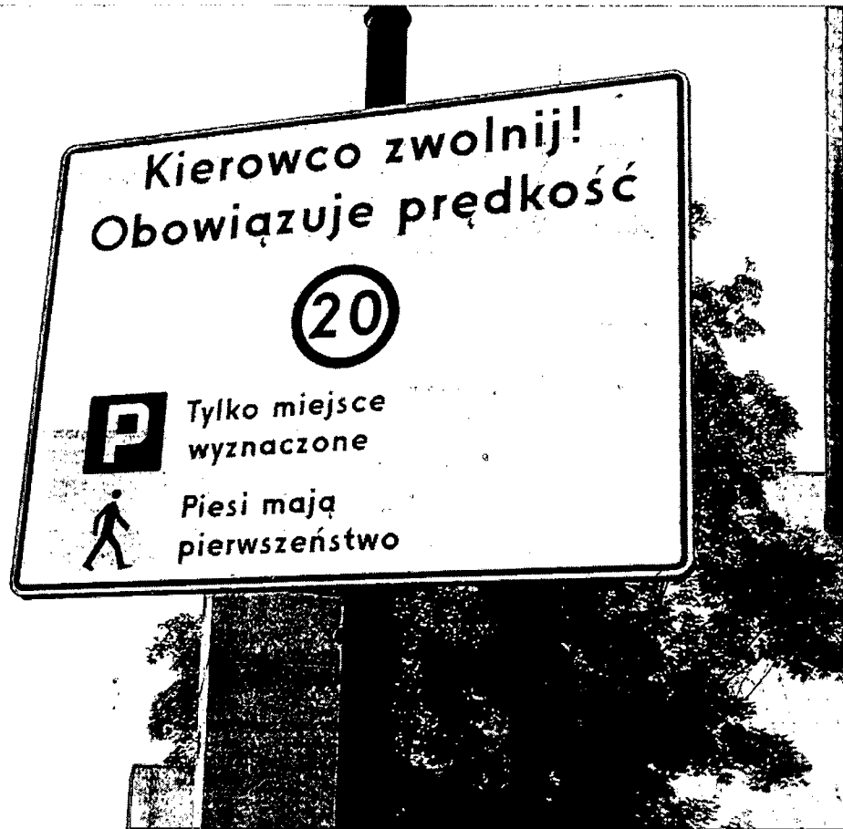
Rysunek 4 - Znak informujący o strefie uspokojonego ruchu na starówce w Sieradzu.