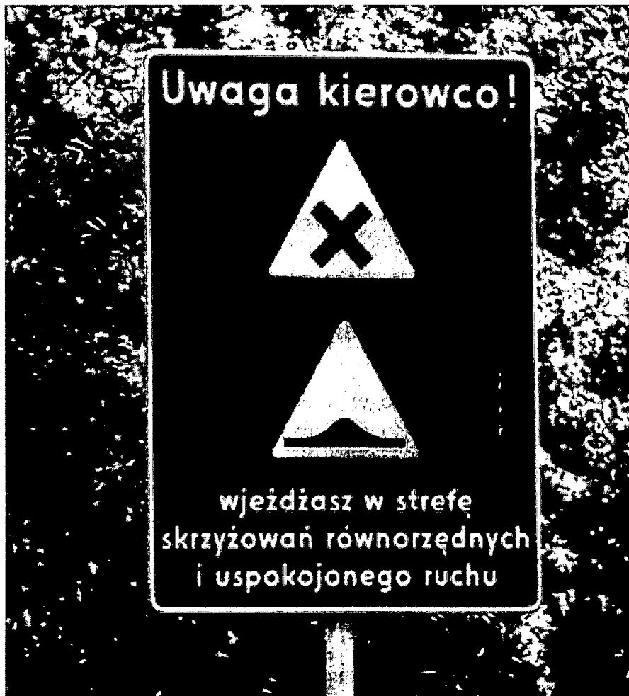
Rysunek 3 - Znak informacyjny strefy skrzyżowań równorzędnych

analogii do postawionych znaków tego typu w Gdańsku w strefie skrzyżowań równoległych, lub znaku informacyjnego o zasadach strefy uspokojonej, które stanęły w Sieradzu.