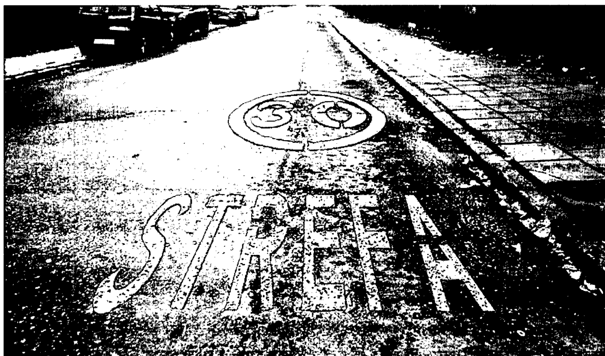
Rysunek 2 - Przykład z Gdańska