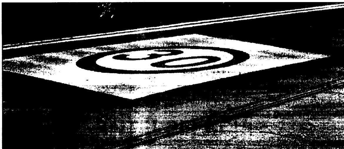
Rysunek 1 - Przykład z Rudy Śląskiej