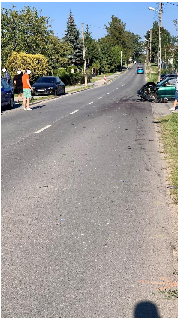
4/ Olechowska 60-64, 21 września 2024