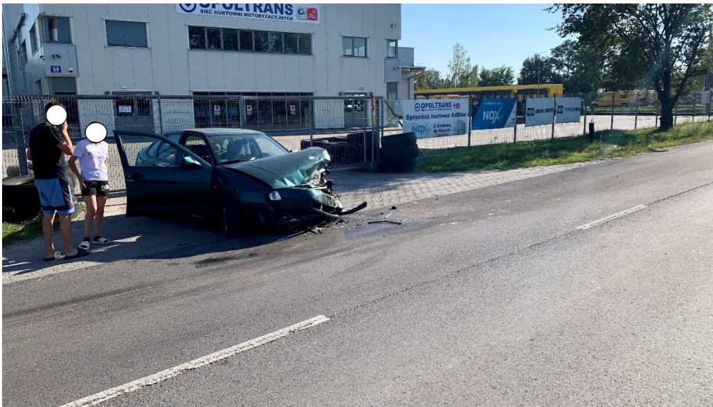
3/ Olechowska 60-64, 21 września 2024