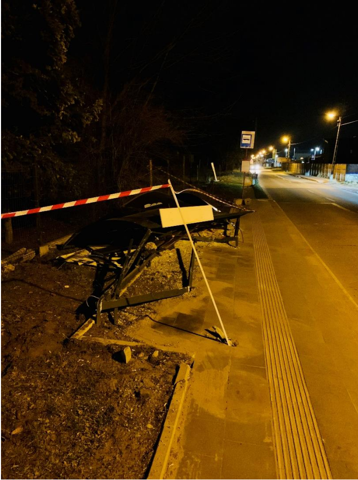
1/ Olechowska 56, 10 marca 2024