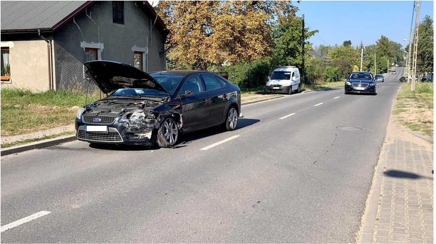
5/ Olechowska 60-64, 21 września 2024