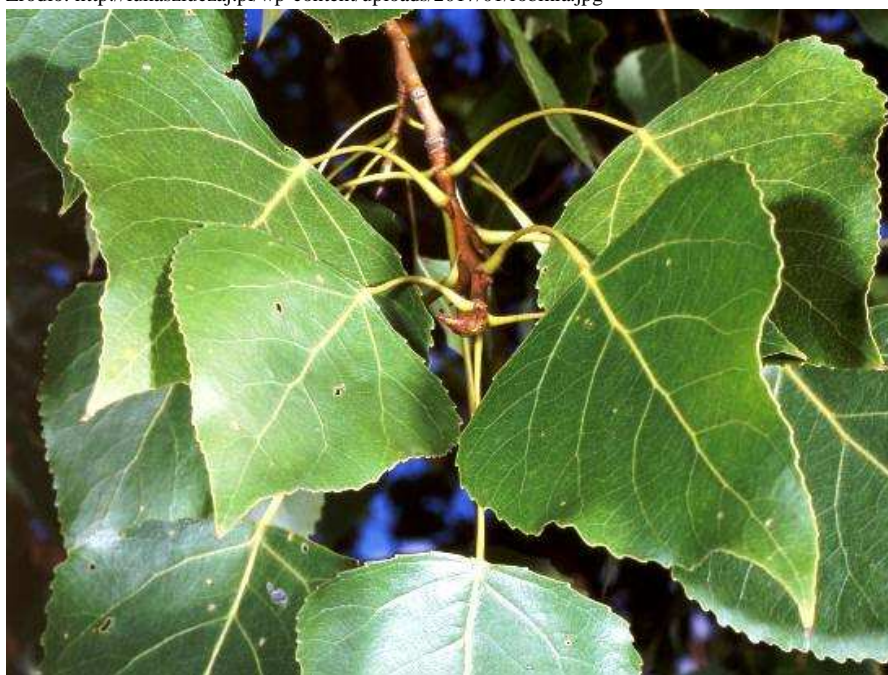
Fot. 2. Topola euroamerykańska