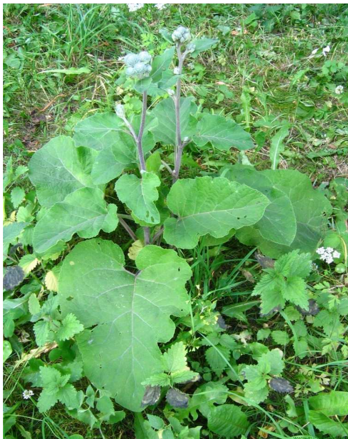
Fot. 7. Łopian pajęczynowaty