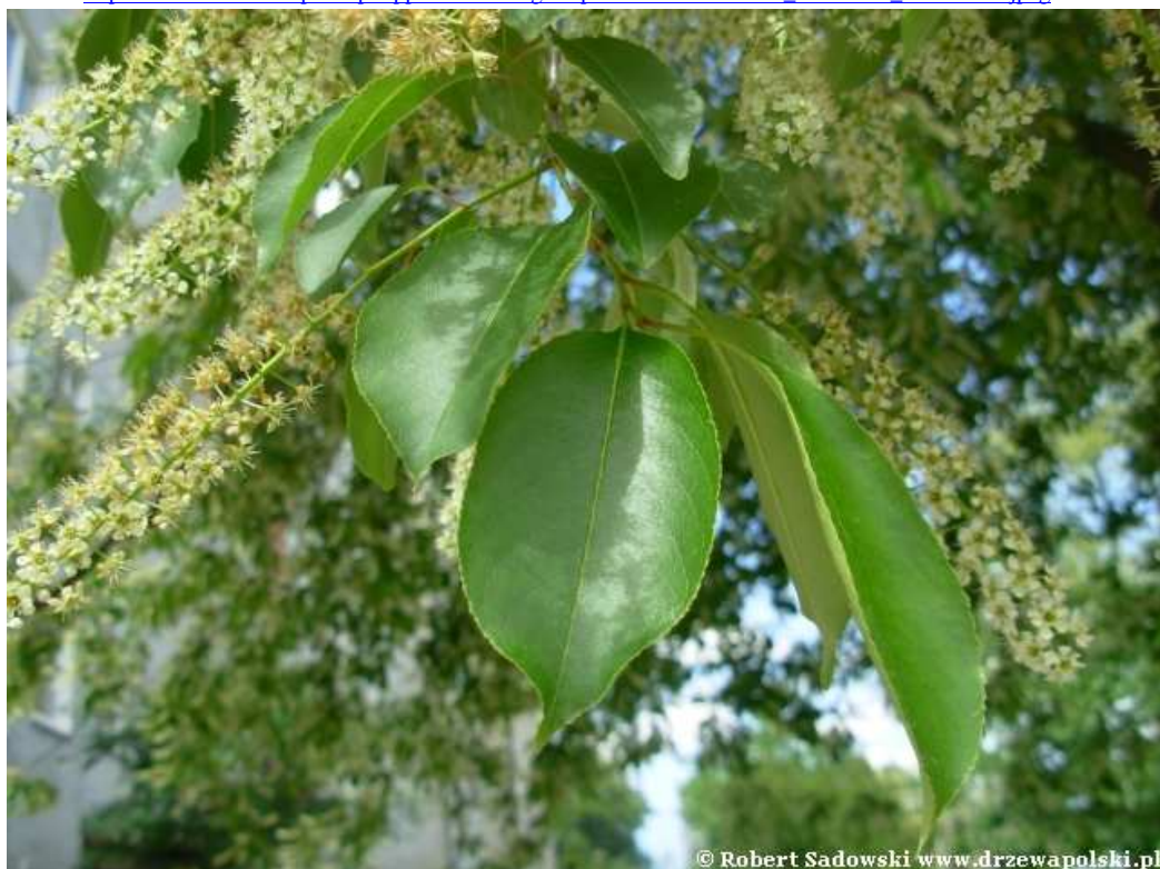
Fot. 4. Czeremcha amerykańska