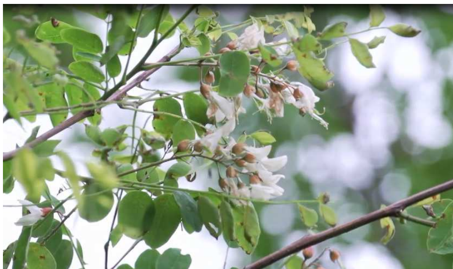
Fot. 1. Robinia akacjowa