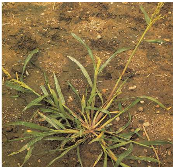
Fot. 8. Chwastnica jednostronna