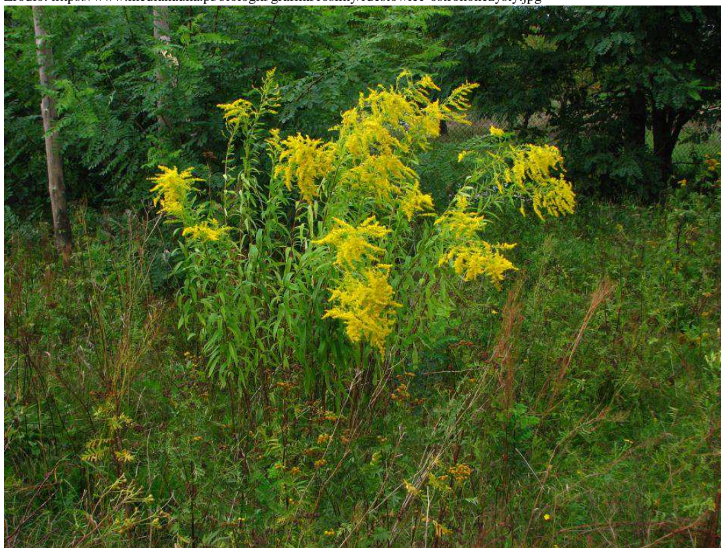
Fot. 6. Nawłóć kanadyjska