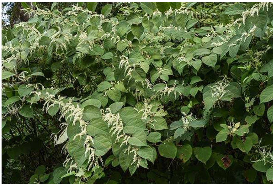
Fot. 5. Rdestowiec ostrokończysty