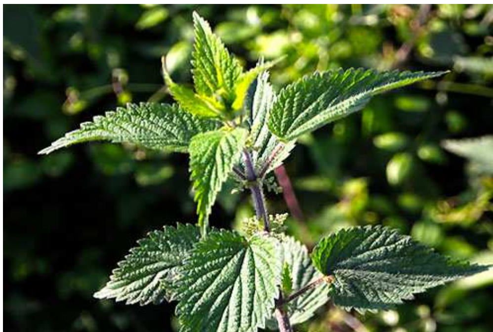
Fot. 10. Pokrzywa zwyczajna