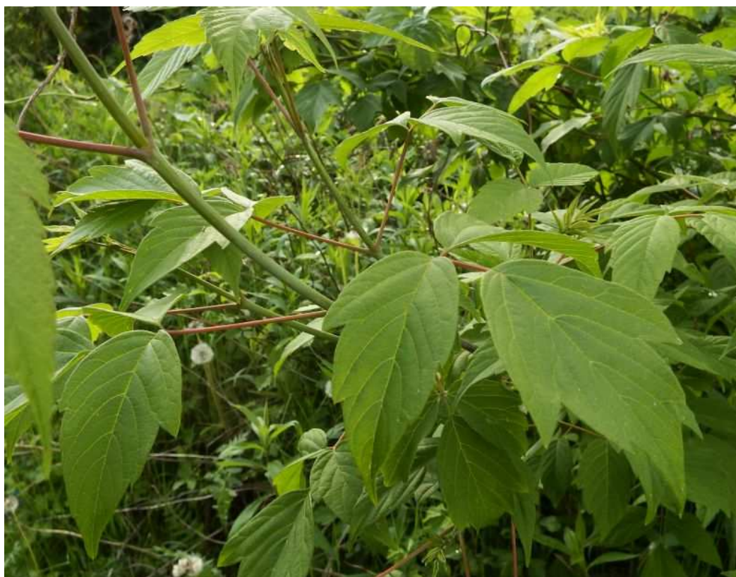
Fot. 3. Klon jesionolistny