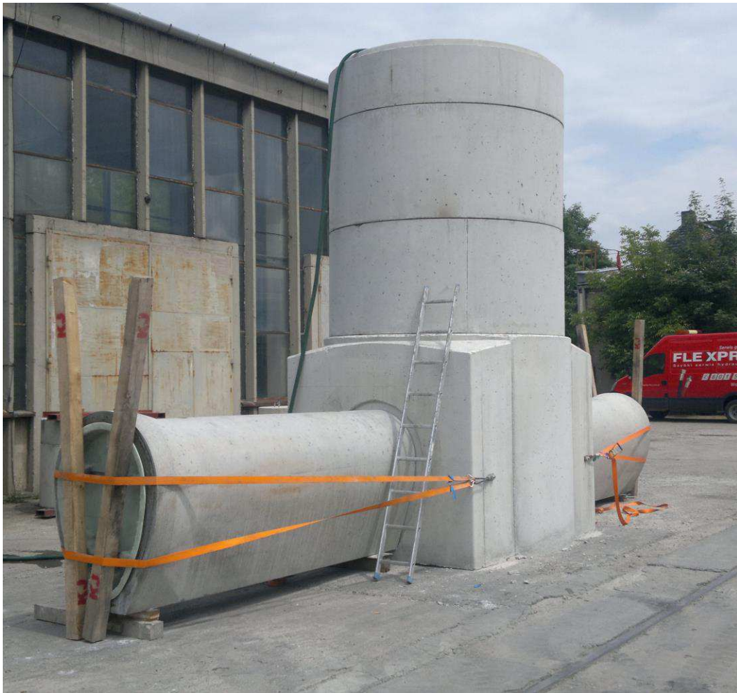
Zdjęcie nr 1: Studzienka DN1500, z nadbudową i dennicą z odsadzeniem