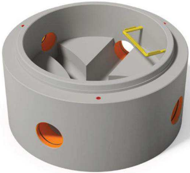
Rysunek 1: Dennica tradycyjna