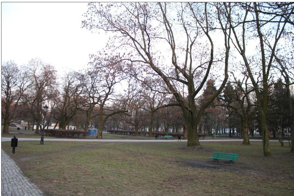
Fot. 3. Widok w kierunku wschodnim na centralną część parku