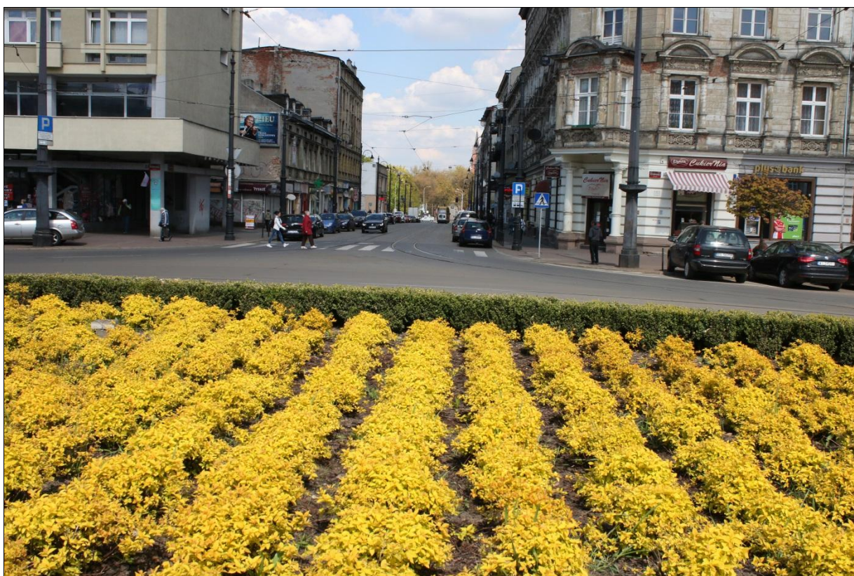
Fot. 6. Patery krzewów w centralnej części Placu Wolności