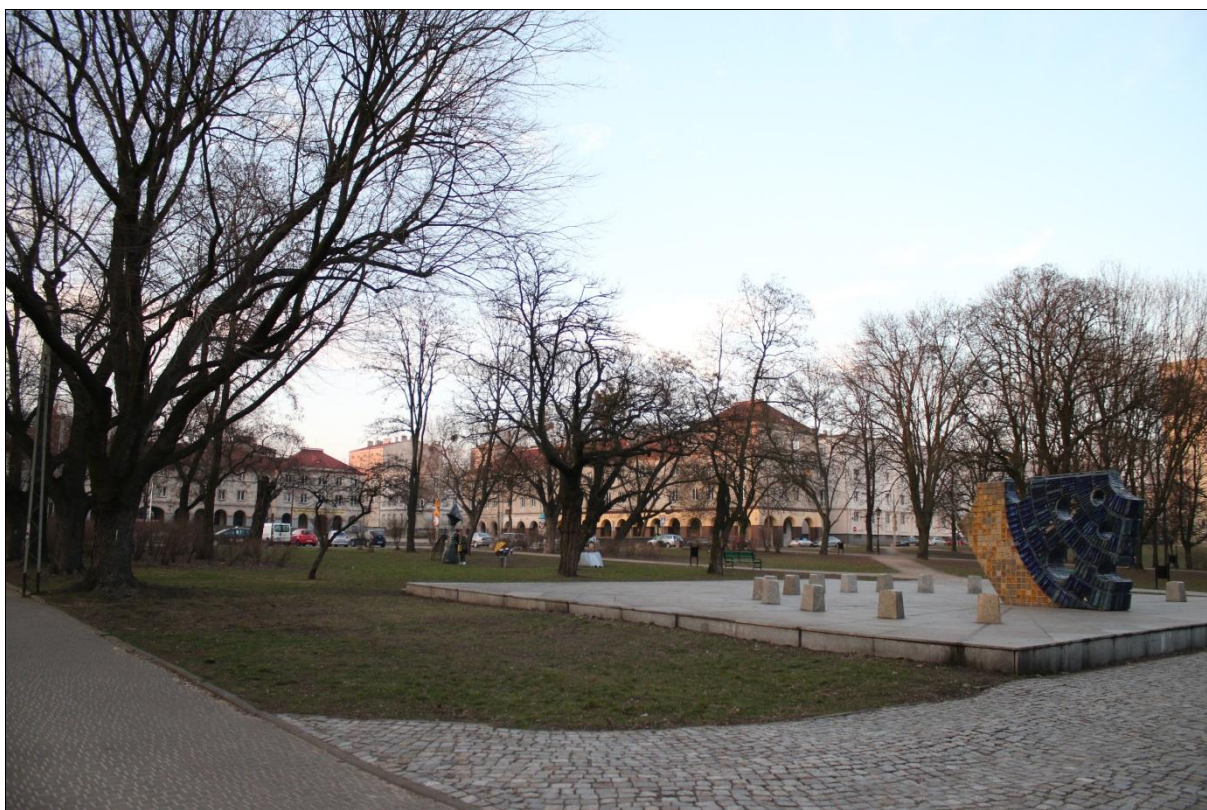
Fot. 2. Środkowa część Parku Staromiejskiego z charakterystycznym zegarem słonecznym