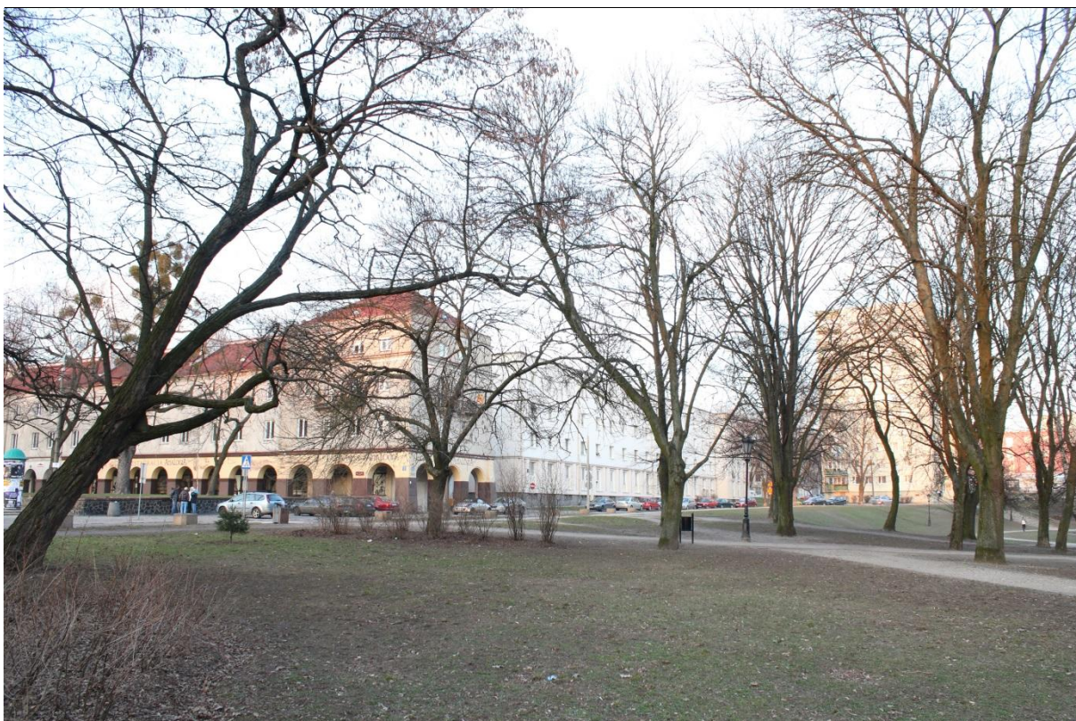
Fot. 1. Grupa drzew w północnej części Parku Staromiejskiego w miejscu planowanej zabudowy