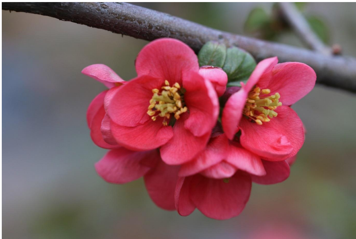
Fot. 8. Kwitnący okaz pigwowca japońskiego Chaenomeles japonica