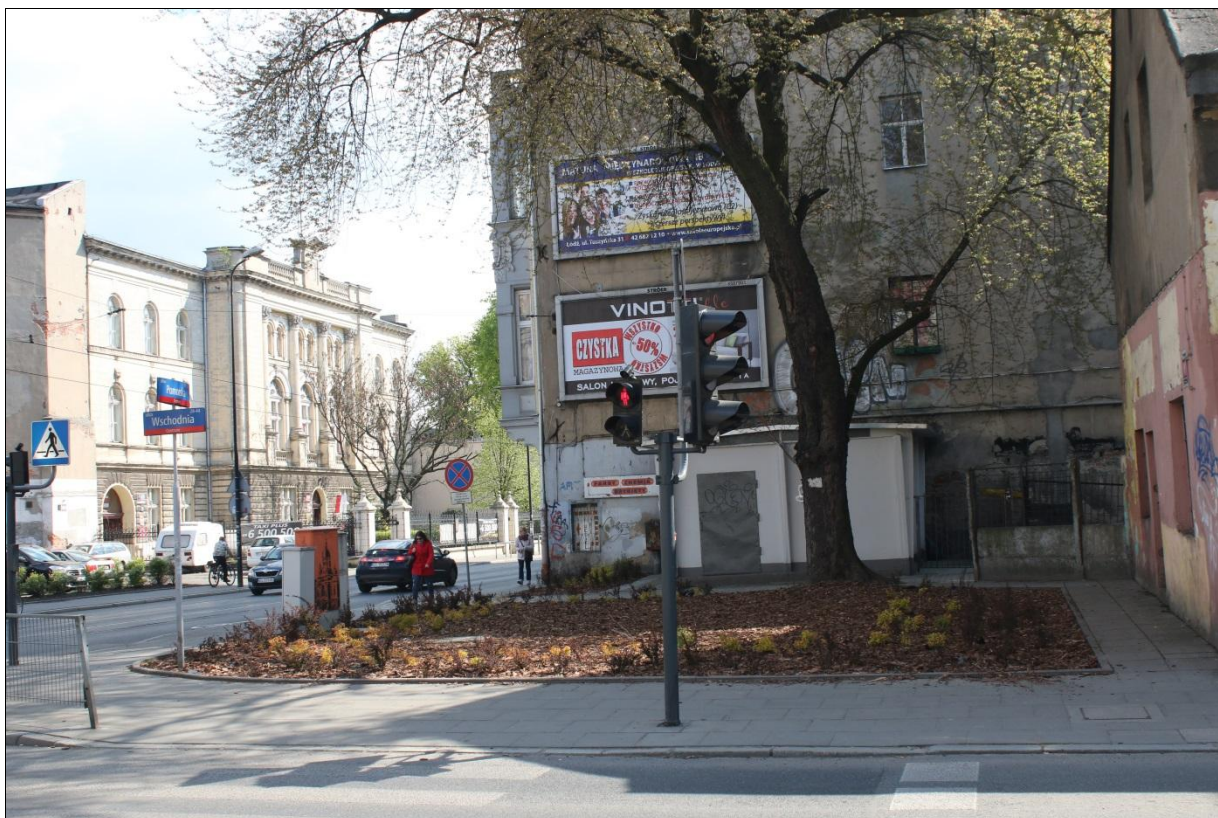
Fot. 5. Okazaly klon srebrzysty Acer saccharinum i nowe nasadzenia przy zbiegu ulicy Wschodniej i Pomorskiej