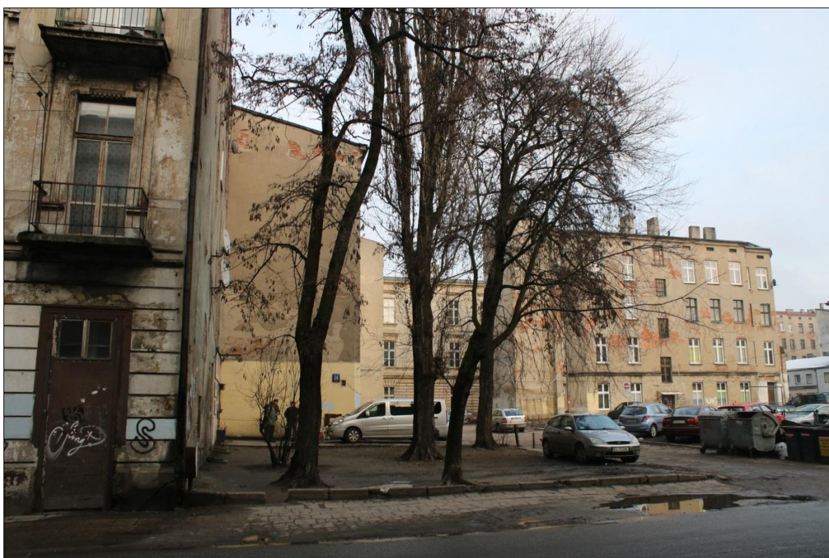
Fot. 4. Grupa robinii akacjowych i topoli włoskich na parkingu przy ulicy Wschodniej/Pomorskiej