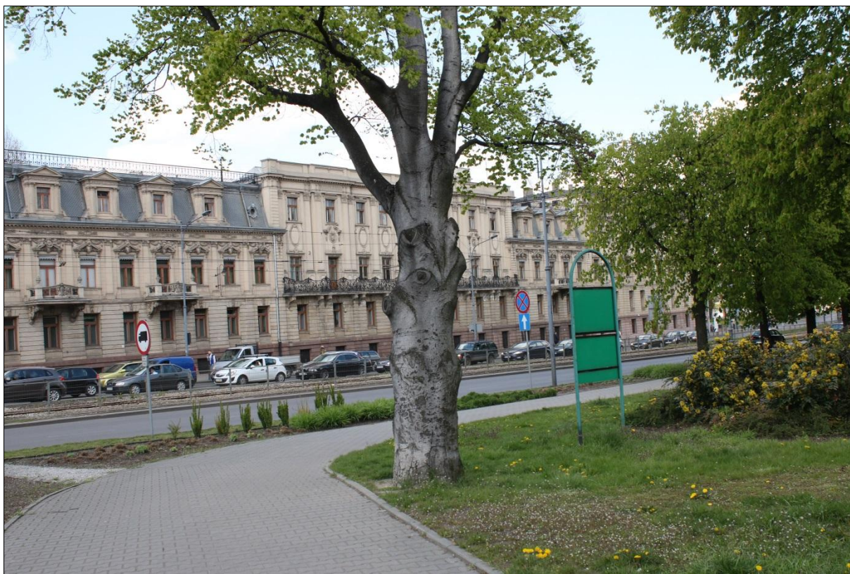
Fot. 9. Okazały buk Fagus sylvatica w Parku Staromiejskim