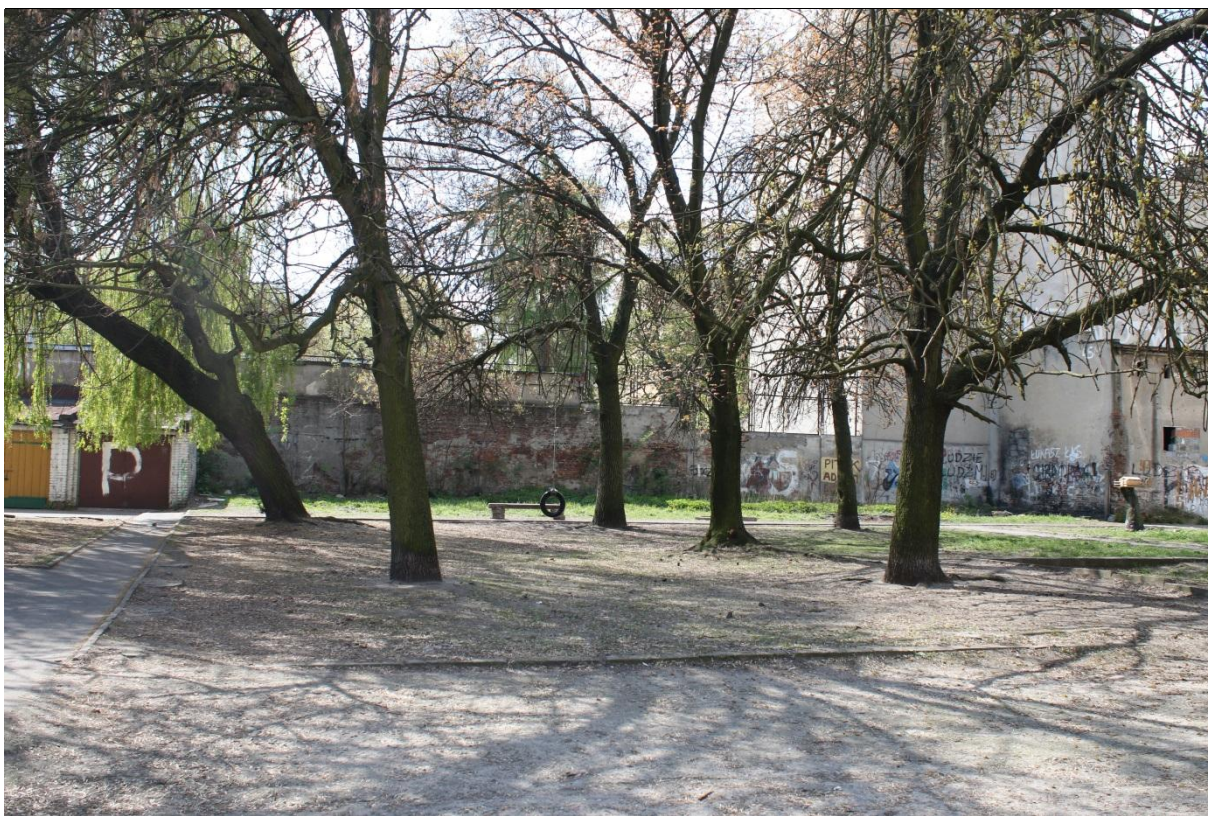
Fot. 7. Drzewa na terenie posesji przy ul. Północnej 23