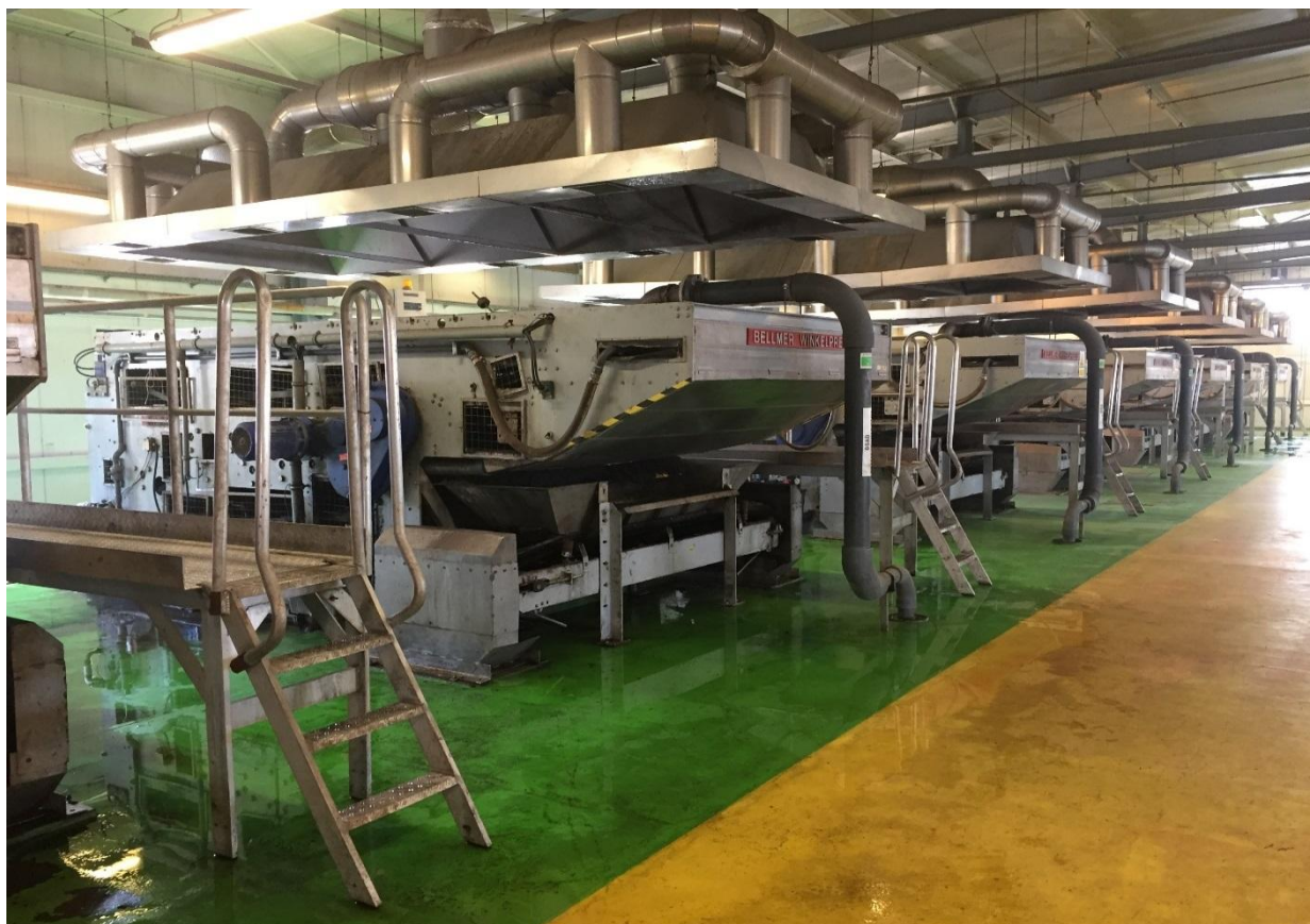
Poziom 4,50. Hala pras

Do odwodnienia osadu przefermentowanego w BMZiOO zamontowano 7 pras taśmowych prod. BELLMER typ WPN-K 3. Zadaniem pras jest odwodnienie osadu przefermentowanego do stanu umożliwiającego termiczne przekształcenie osadu w ITPO (wymagany stopień odwodnienia 18 \div 22 % s.m.).