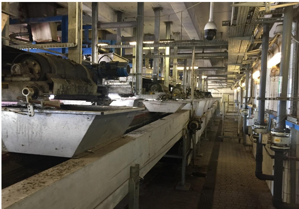
Poziom 0,00. Przenośniki osadu odwodnionego do ITPO.