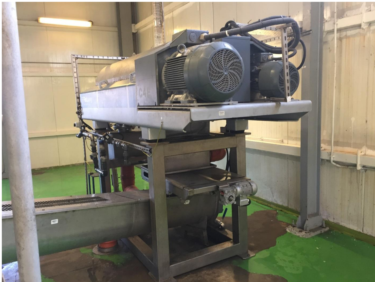
Poziom 4,50. Wirówka dekantacyjna na stanowisku nr 8.

Osad odwodniony na wirówce transportowany jest przenośnikiem śrubowym do przenośnika odbioru osadu spod prasy nr 7.