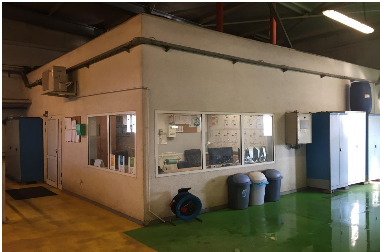
Poziom 4,50. Zaplecze socjalne wraz ze sterownią lokalną.

W ramach zamówienia należy zaprojektować i wykonać rozbudowę tzw. zaplecza socjalnego w budynku 10 w celu dostosowania jej do bieżących i nowych potrzeb obsługi obiektu. Należy przewidzieć zachowanie istniejących funkcji części socjalnej tj. sterowni lokalnej, szatni brudnej i czystej, pomieszczeń prysznicowych, jadalni, sanitariatów.