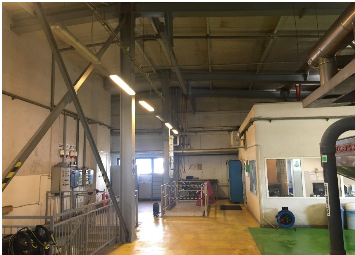
Poziom 4,50. Otwór montażowy, zaplecze socjalne.