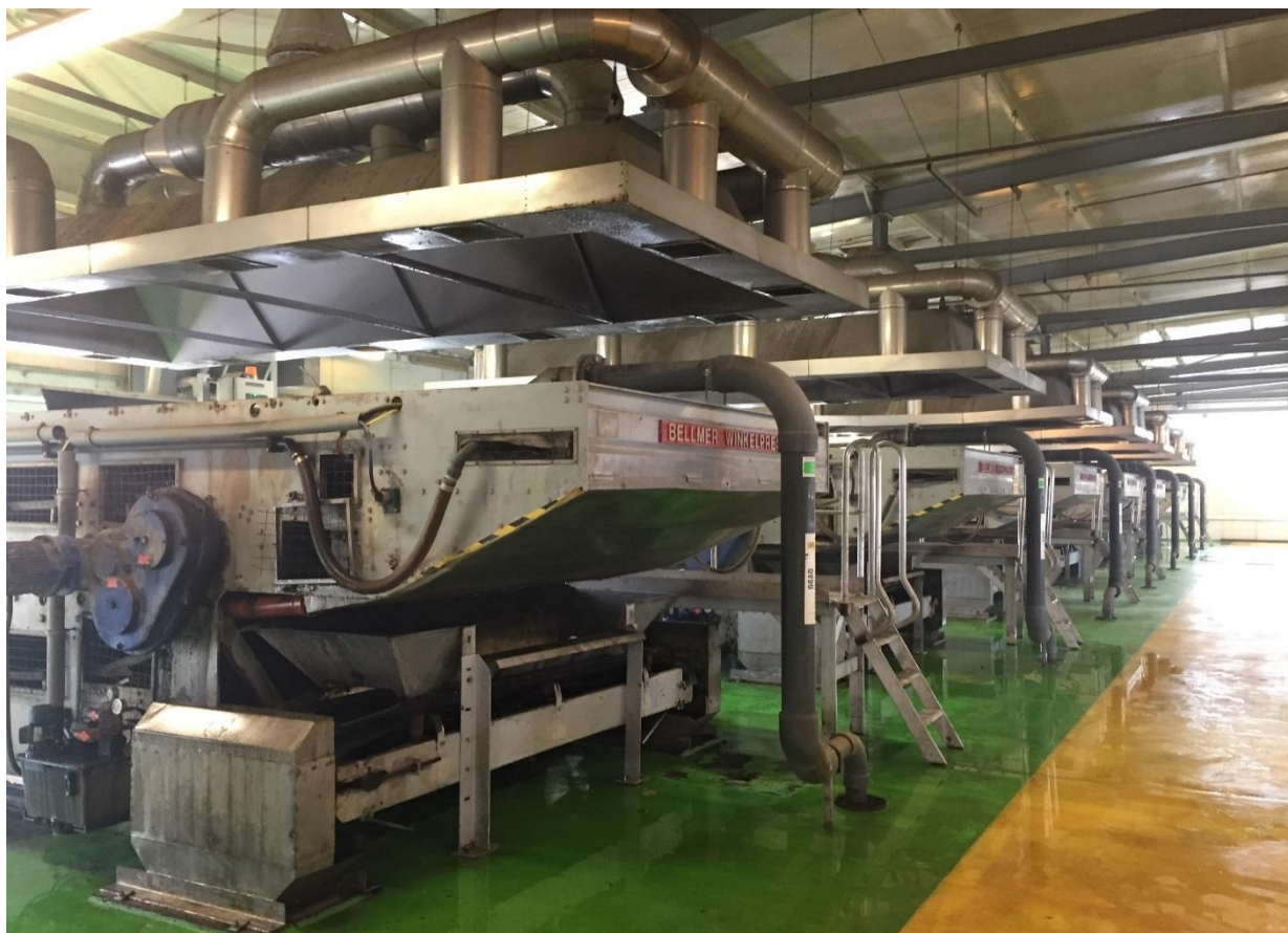
Poziom 4,50. Prasy odwadniające wraz z okapami

Dopływ oraz odpływ powietrza z nad pras zapewnił jest przez wentylatory wyciągowe znajdujące się na dachu budynku oraz nawiewne umieszczone w ścianie zewnętrznej. Okapy zostały podwieszane do konstrukcji budynku za pomocą linek wykonanych ze stali kwasoodpornej.