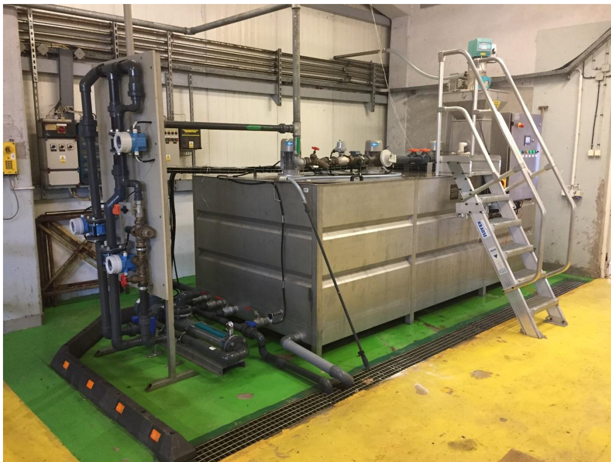
Poziom 0,00. Stacja polielektrolitu nr 5