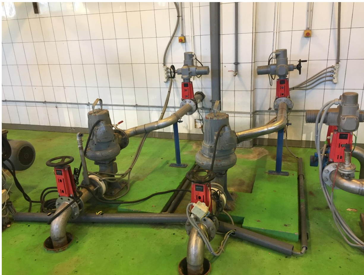
Poziom 0,00. Układ pompowy osadu na prasy

Pompami Vogelsang osad przefermentowany tłoczony jest rurociągiem DN 200 ze stali nierdzewnej zlokalizowanym w kanale wielofunkcyjnym (łąującym zbiorniki osadu przefermentowanego z budynkiem nr 10) oraz kanałem podposadzkowym w pomieszczeniu pomp i przygotowywania polielektrolitów. Z rurociągu DN 200 poprzez odejścia DN 100 osad trafia na 7 szt. pomp FLYGT typ 3102.181 podających osad bezpośrednio na prasy.