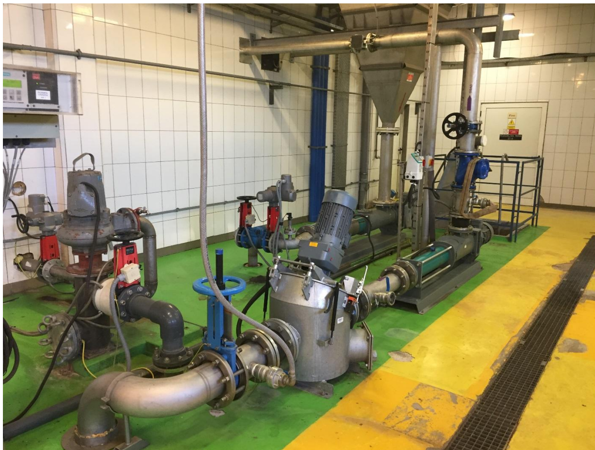
Poziom 0,00. Układ pompowy osadu na wirówkę.

Z rurociągu pod posadzkowego osad podawany jest również na wirówkę FLOTTWEG. Na przewodzie DN 150 przed pompą zainstalowany został macerator typ Netzsch M-OVAS_S1-4.0/300 o wydajności nominalnej 25 m 3 /h. Osad na wirówkę podawany jest przez pompę typ Netzsch NM076BY01L06B.1 o wydajności nominalnej 25 m 3 /h,