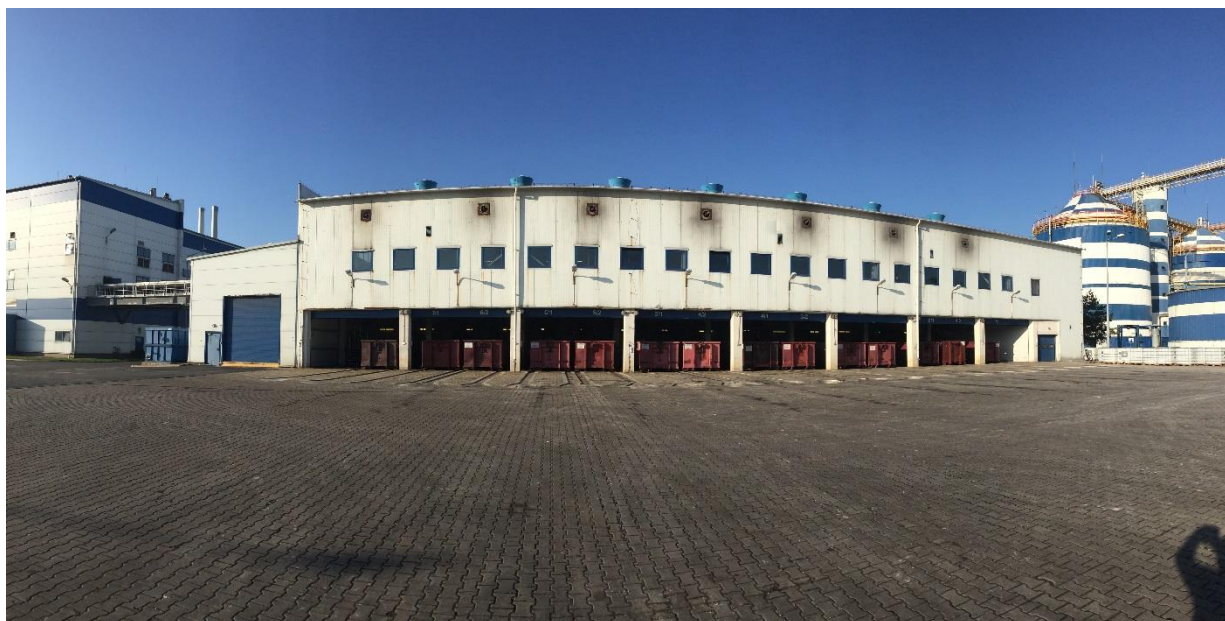
Budynek nr 10. Widok od strony stanowisk kontenerów

Ściany wewnętrzne części socjalnej wykonane zostały z cegły pełnej i bloczków gazobetonowych YTONG o grubości 11,5 cm, 20 cm i 24 cm.