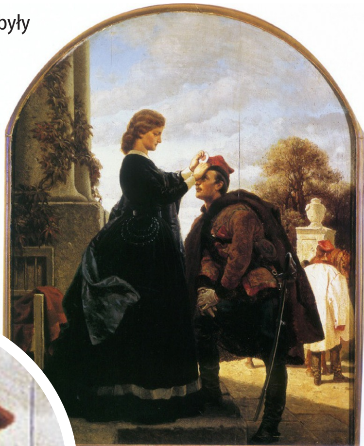
„Pożegnanie powstańca”. Część dyptyku Artura Grottgera namalowanego w latach 1865-1866. Muzeum Narodowe w Krakowie.

Na słynnym obrazie Artura Grottgera „Pożegnanie i powitanie powstańca” kobieta przypina żegnanemu żołnierzowi kokardę, w której biel widnieje na zewnętrznym okręgu.