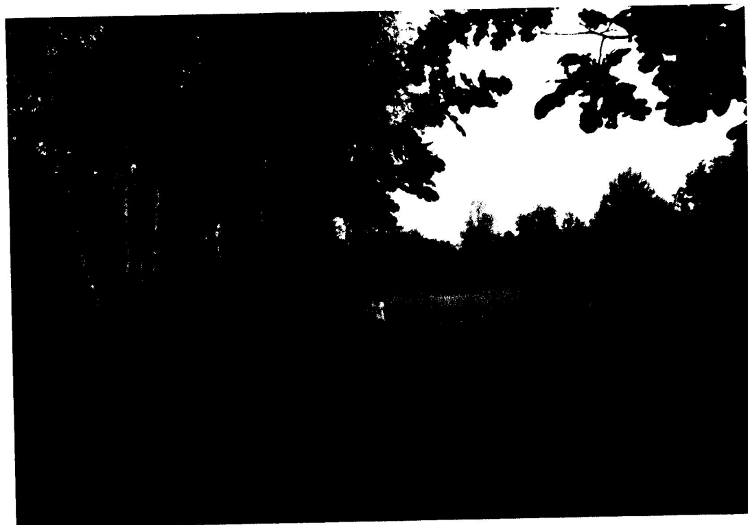
Fot. 7. Duża polana w centrum terenu zielonego.