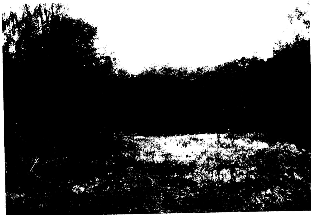
Fot. 6. Sucha polana z miejscem piknikowym.