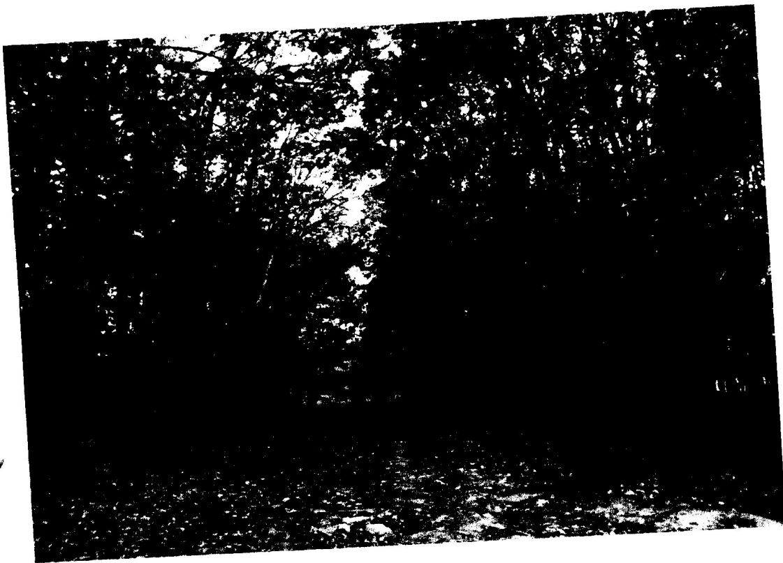
Fot. 10. Las klonowy z dawnej szkółki drzew.