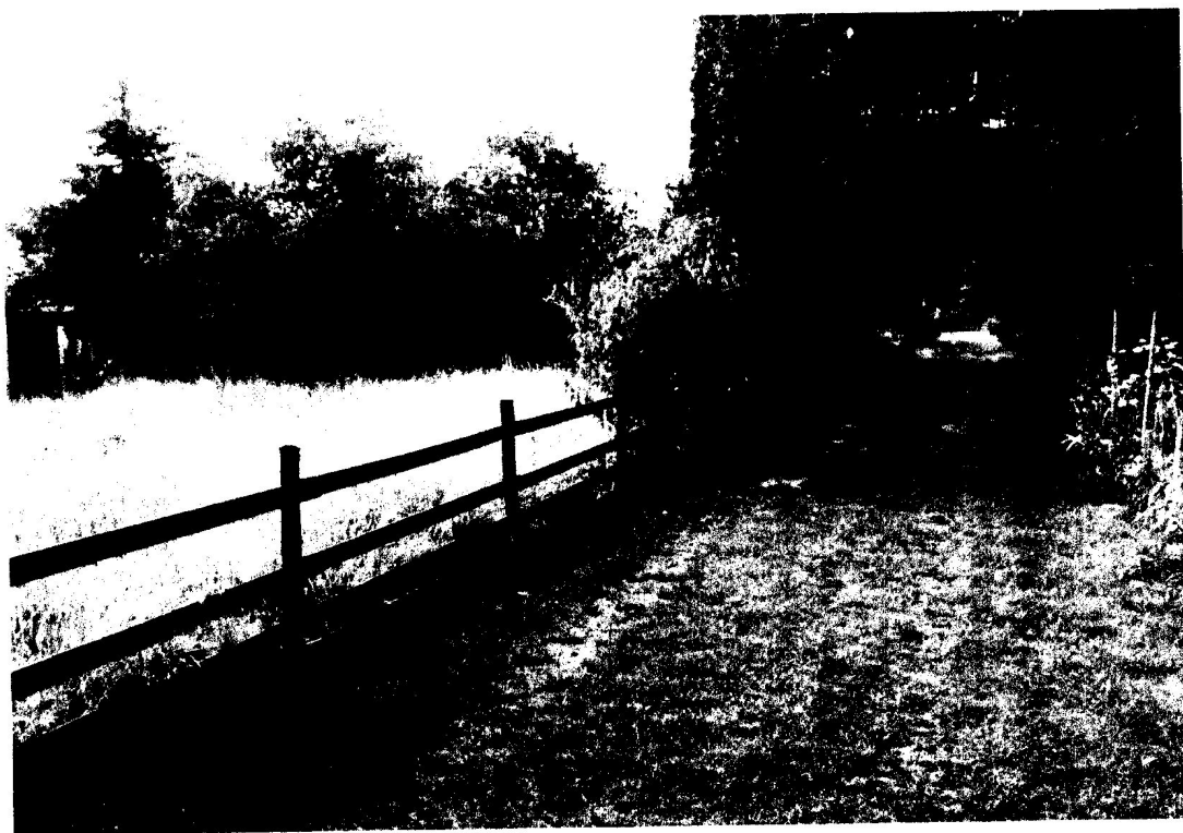
Fot. 3. Widok drogi wewnętrznej przyległych ogródków działkowych.