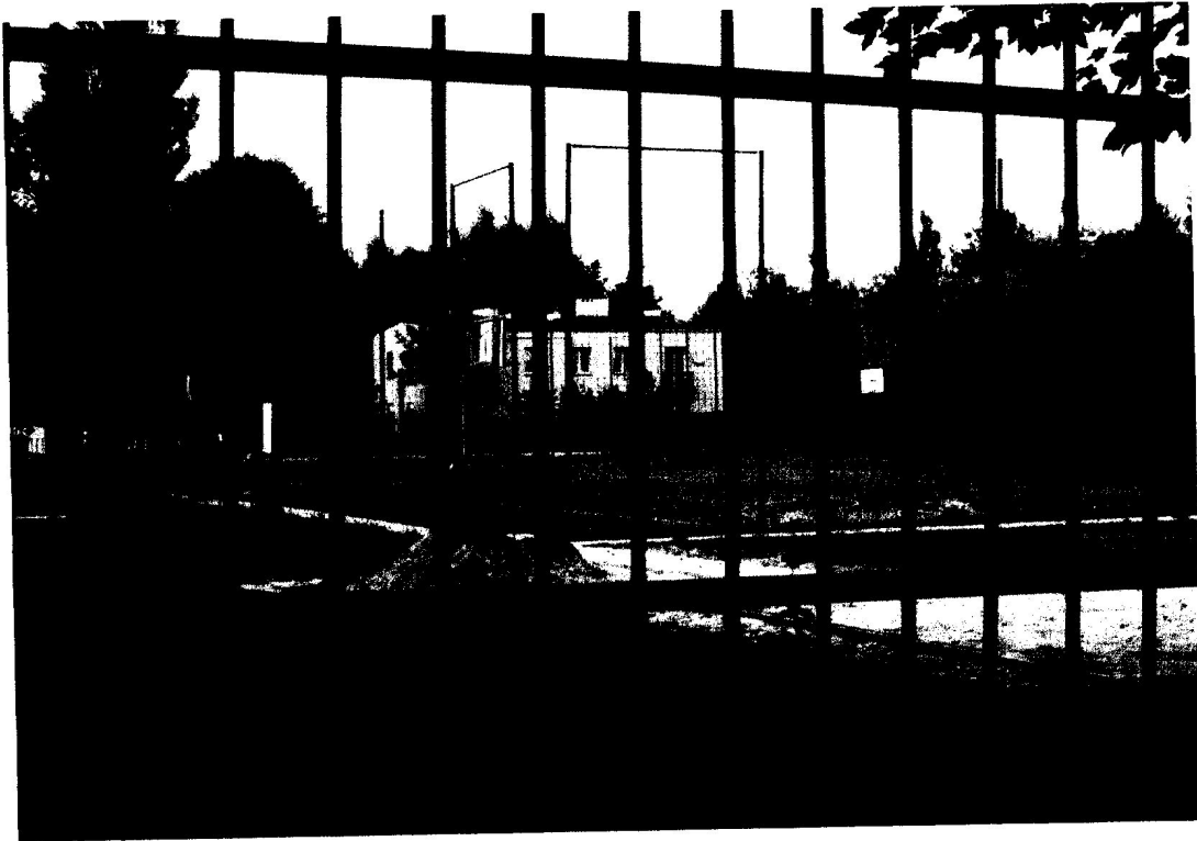
Fot. 4. Boisko szkolne z budynkiem mieszkalnym przy Centralnej.