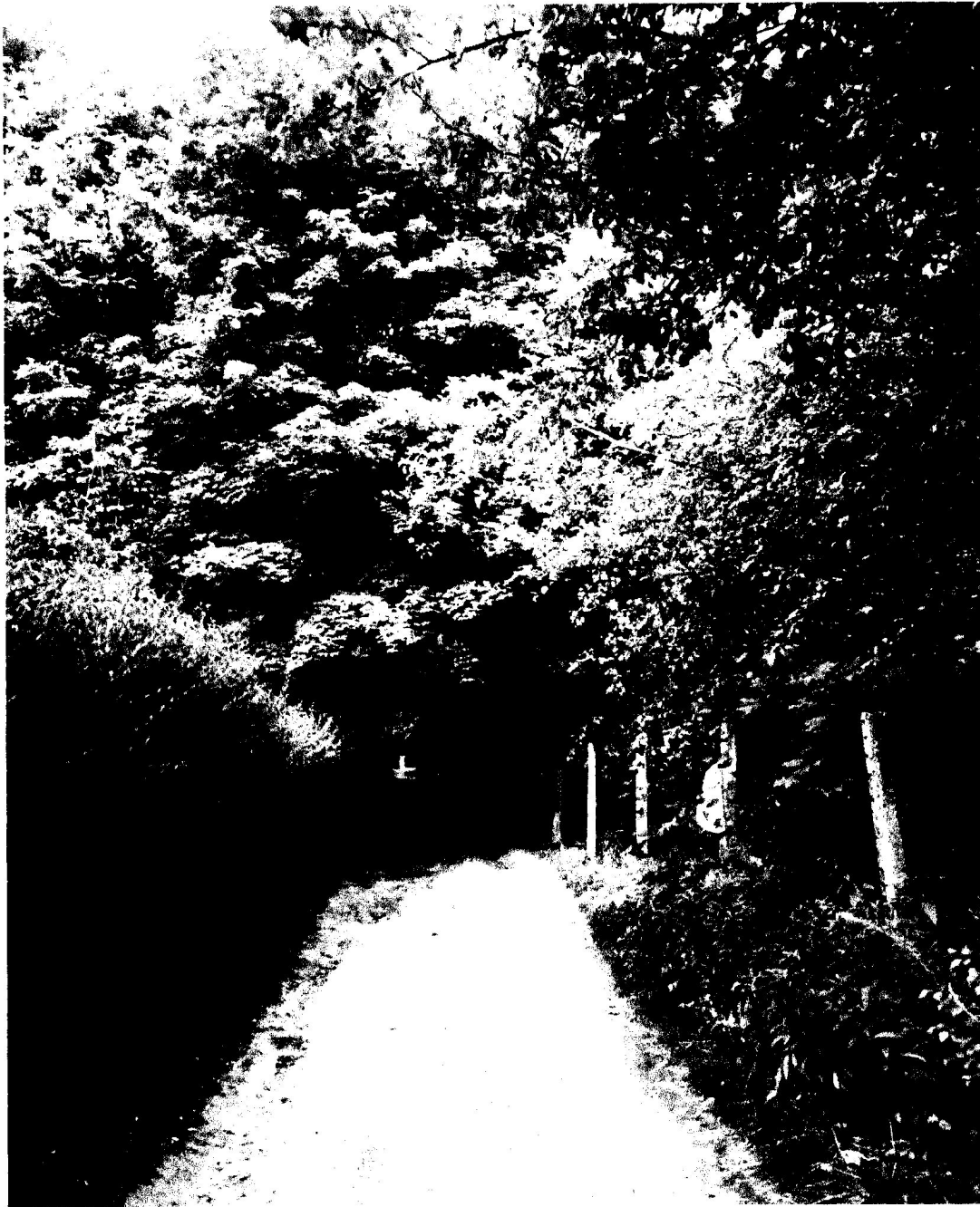
Fot. 1. Droga pieszo-jezdna od Warszawskiej do Centralnej w północnej części terenu wzdłuż ogródków działkowych.