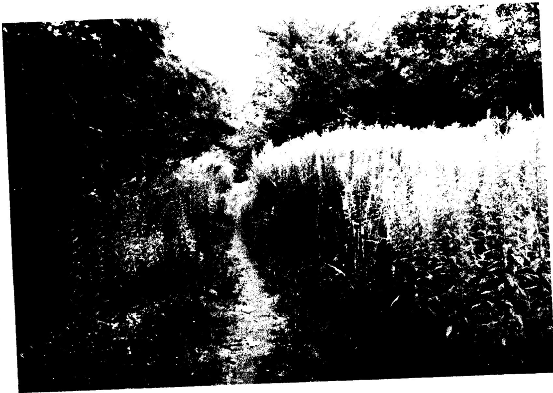
Fot. 8. Ścieżka w kierunku Wycieczkowej.