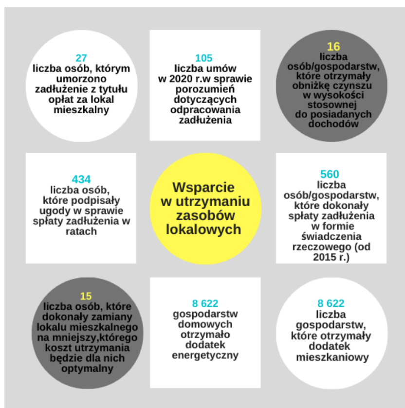
Schemat nr 3. Wsparcie w utrzymaniu zasobów mieszkaniowych

Wsparcie w zaspokojeniu potrzeb związanych z utrzymaniem mieszkania realizowane było w 2020 r. także poprzez udzielenie pomocy w formie dodatku energetycznego. Pomoc przyznawana była na wniosek osoby zainteresowanej. Uzyskanie wsparcia zależy od spełnienia przez wnioskodawcę i osoby wspólnie gospodarujące warunków regulowanych ustawą z dnia 10 kwietnia 1997 r. - prawo energetyczne (Dz.U. z 2020 r. poz. 833 ze zm.). W 2020 roku z pomocy finansowej w formie dodatku energetycznego skorzystało 3 373 gospodarstw domowych. Centrum Świadczeń Socjalnych w Łodzi wypłaciło w 2020 r. dodatki energetyczne na kwotę 404 254,71 zł.