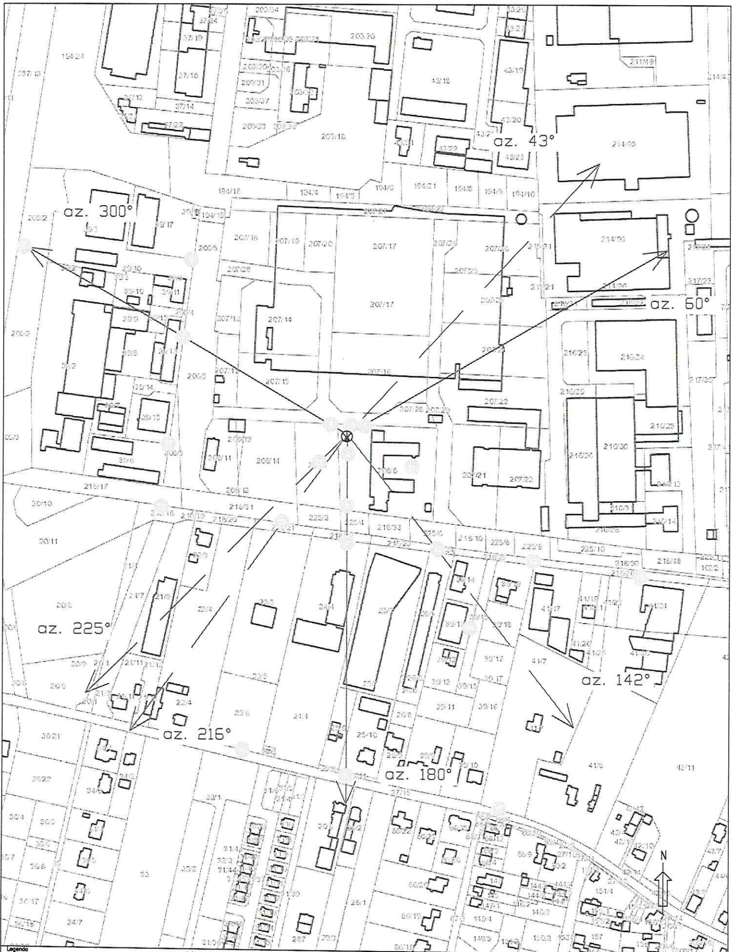
Rys.1 Lokalizacja pionów pomiarowych