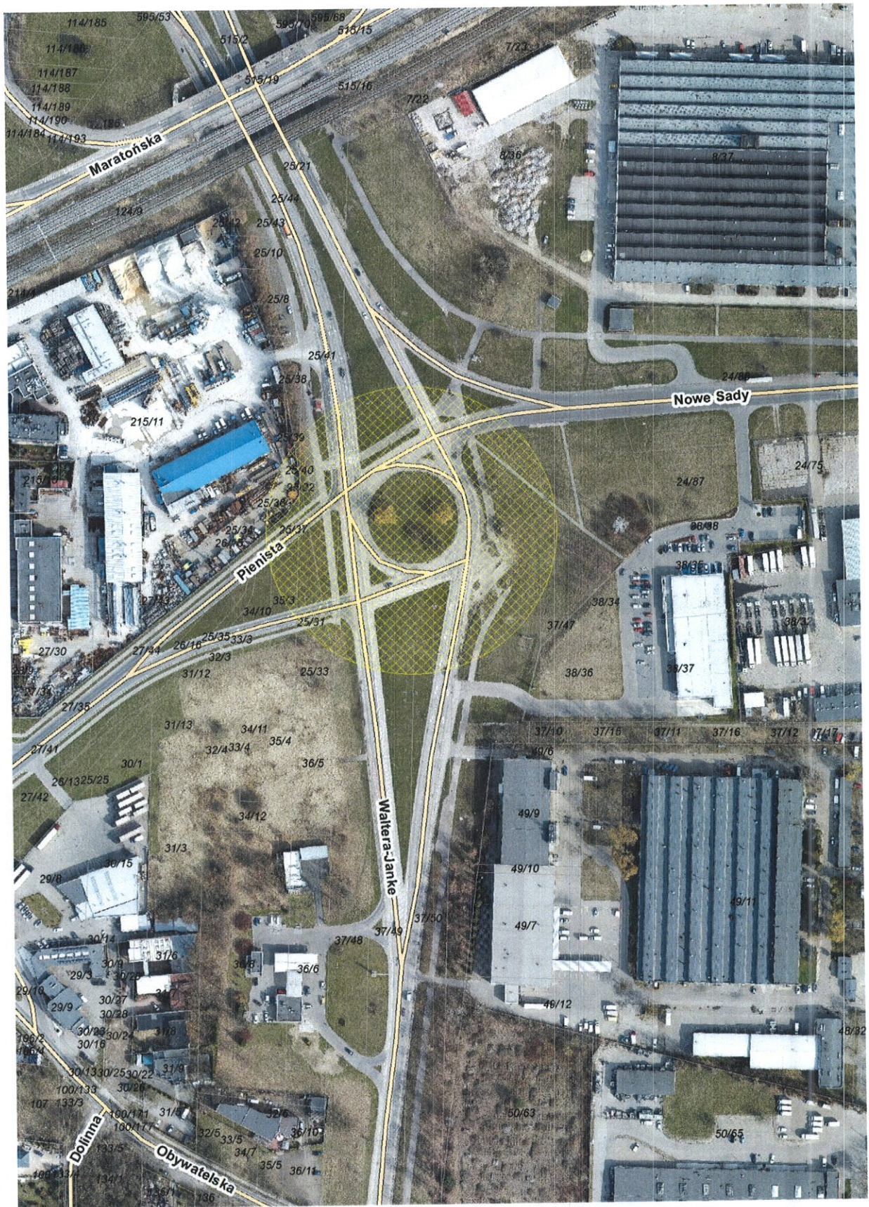
Załącznik graficzny do projektu uchwały