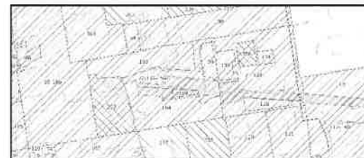
REJON NOWEGO CENTRUM ŁÓDZI - POWIĘKSZENIE: