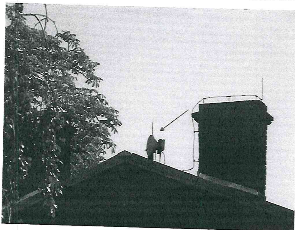
Widok instalacji radiokomunikacyjnej Stacja Netia LODZB398 - LODZM00337 Łódź, ul. Ks. Biskupa Wincentego Tymienieckiego 30A.