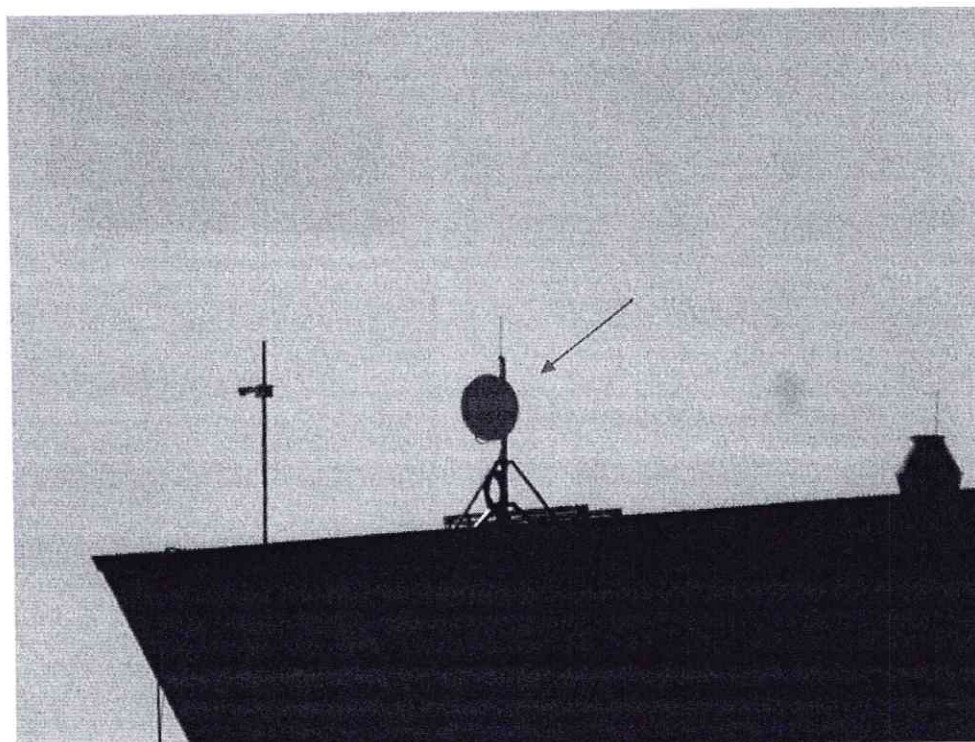
Widok instalacji radiokomunikacyjnej Stacja Netia LODZB303 - LODZM00284 Łódź, ul. Techniczna 5.