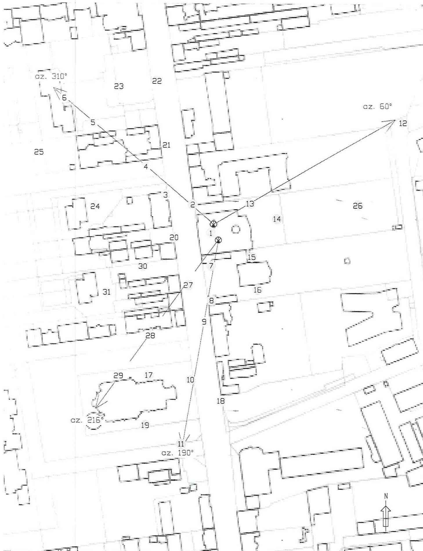
Rys.1 Lokalizacja pionów pomiarowych