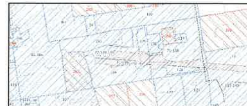
REJON NOWEGO CENTRUM ŁODZI - POWIĘKSZENIE: